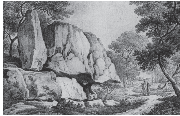
Figure 2 : Clisson, la Sèvre nantaise et la Garenne Lemot

Clisson, the Sèvre nantaise Valley and the Garenne Lemot garden