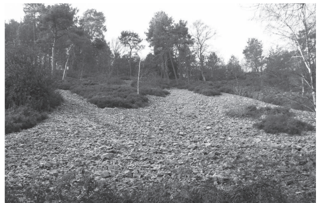
Figure 3 : La vallée de Misère et ses versants minéraux

The Valley of Misère and its mineral hill slopes