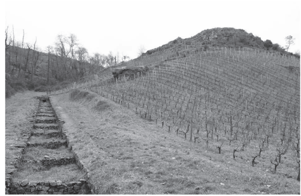
Figure 5 : Les coteaux du Layon et le site du Pont-Barré