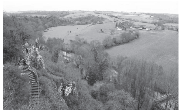
Figure 4 : La vallée de l'Èvre et le cirque de Courossé