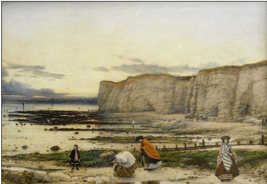
Photo 3 - L'appropriation par la représentation iconographique : William Dyce, Pegwell Bay, Kent (A recollection of October 5 th 1858 , Tate Gallery, Londres).