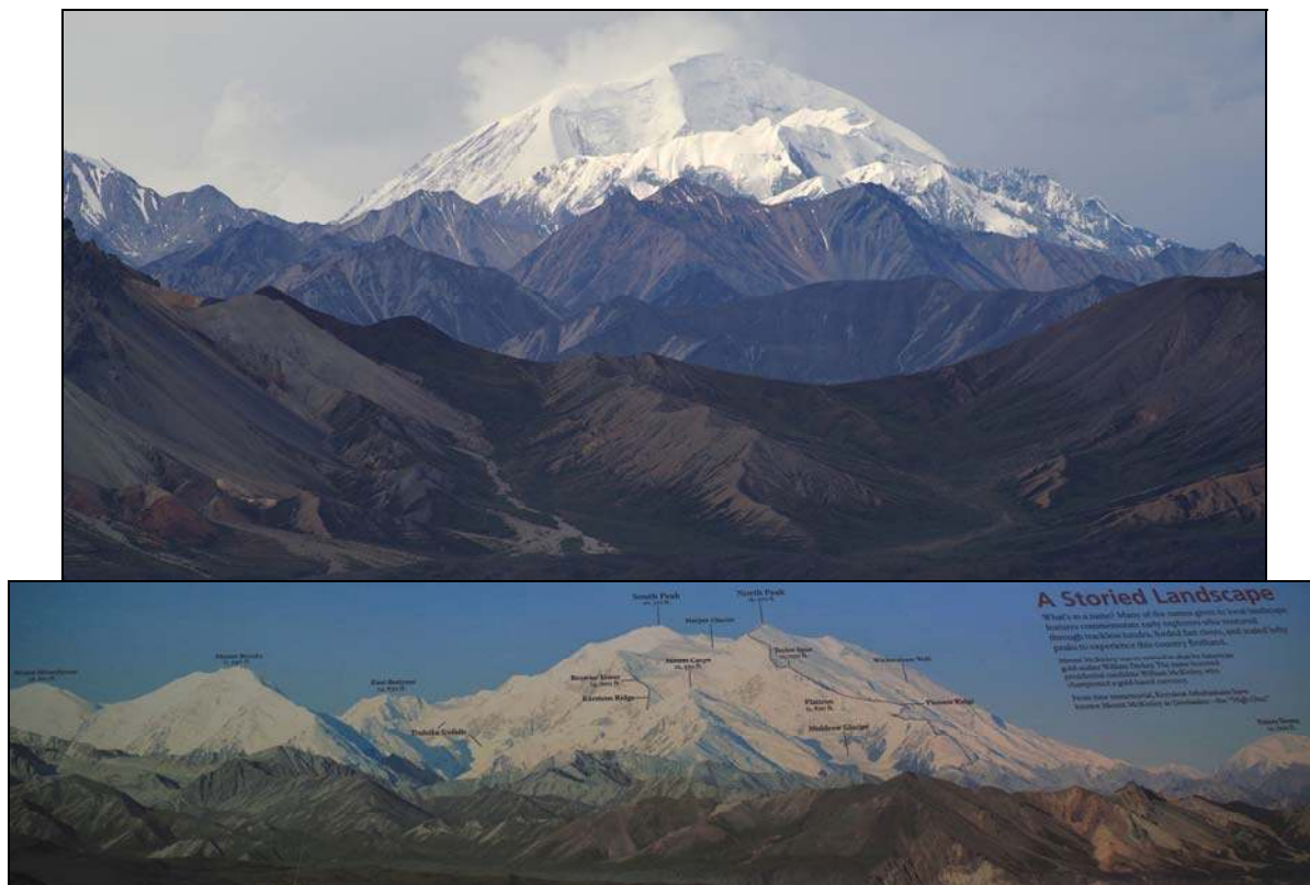
Photos 7 - L'appropriation directe des reliefs par le tourisme et par l'exploitation économique : le mont Denali (mont McKinley), massif le plus élevé d'Amérique du Nord (6171 m), vu depuis le centre d'accueil du parc national du même nom en Alaska.