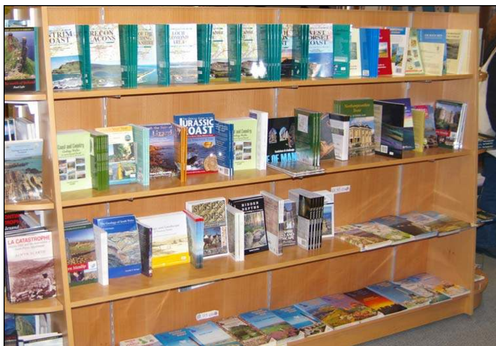
Photo 1 - L'appropriation des reliefs par leur description : une partie des collections de guides géologiques et géomorphologiques en vente à la librairie du Natural History Museum de Londres.

Les guides, écrits et illustrés par des auteurs qui disposent d'une connaissance directe ou indirecte des sites considérés, répondent à une démarche particulière : inciter à la visite, donc à aller voir. Ils répondent aussi à un objectif pratique : pouvoir servir sur le terrain (Photo 1). Les Guides Joanne , puis Les Guides Bleus , sont restés fameux pour leurs présentations géographiques. Les Guides Michelin , qui associent très tôt tourisme et trajets automobiles, publient également des informations utiles sur les reliefs. Plus récemment, les guides géologiques et naturalistes (tels que ceux publiés, entre autres, par les éditions Masson, Hachette, Gallimard ou Delachaux et Niestlé), où la géomorphologie demeure souvent indifférenciée de la géologie, se distinguent par la qualité de leurs commentaires et de leurs illustrations. De tels ouvrages participent eux aussi indirectement, à la patrimonialisation des reliefs et à la vulgarisation de la géomorphologie. Des descriptions de reliefs se sont développées, au cours des dernières années, sur d'autres supports que le papier : applications pour smartphones et tablettes, utilisation de sites internet (N. CAYLA, 2009 ; G. REGOLINI-BISSIG, 2012 ; S. MARTIN, 2013).