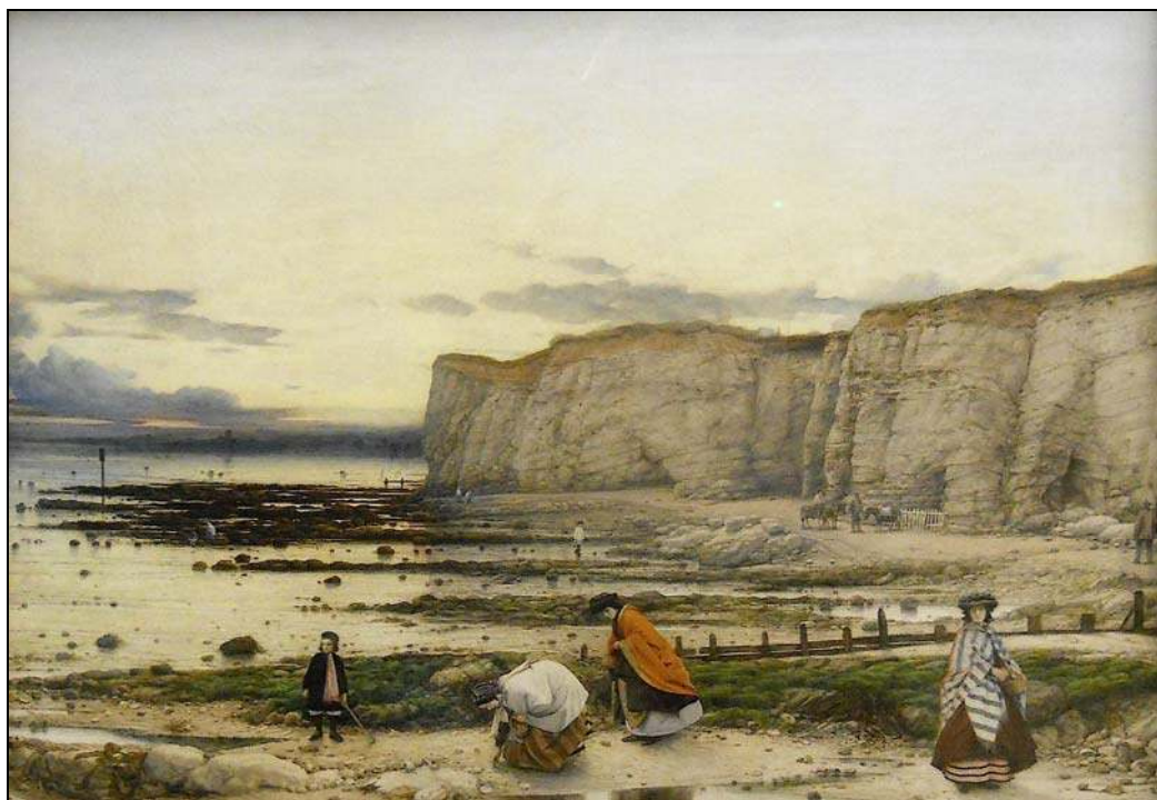
Photo 3 - L'appropriation par la représentation iconographique : William Dyce, Pegwell Bay, Kent (A recollection of October 5 th 1858 , Tate Gallery, Londres).