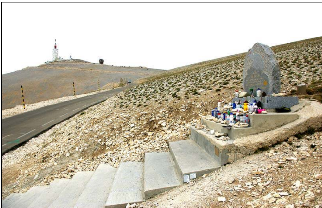
Photo 4 - L'instrumentalisation commémorative des reliefs.

À 1780 m d'altitude, à moins d'un kilomètre (et en vue) du sommet du mont Ventoux (1910 m), en Haute Provence calcaire, la stèle érigée à la mémoire du champion du monde de cyclisme Tom SIMPSON, où subsiste l'usage de déposer une pierre ou un bidon, 50 ans après l'accident.