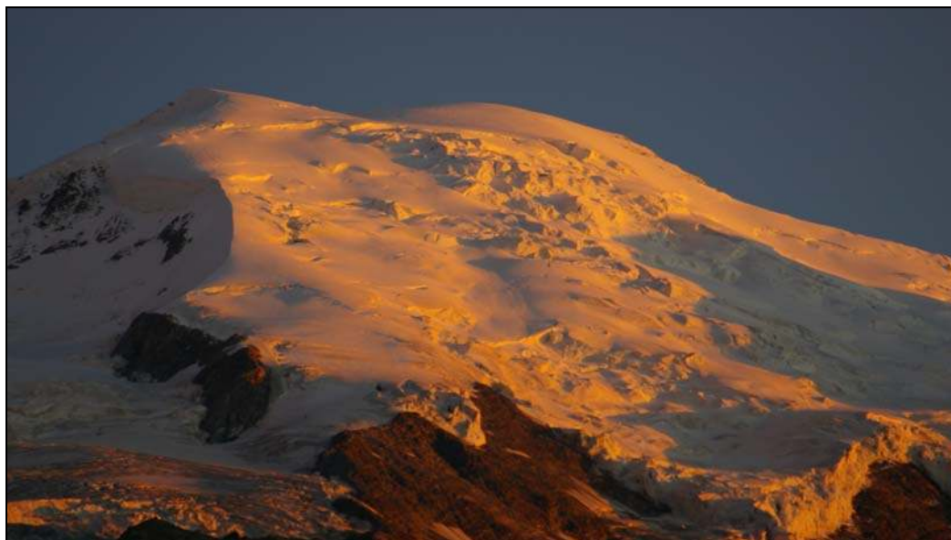
Photo 6 - L'appropriation des reliefs par l'exploit ou par la conquête : le Mont Blanc.