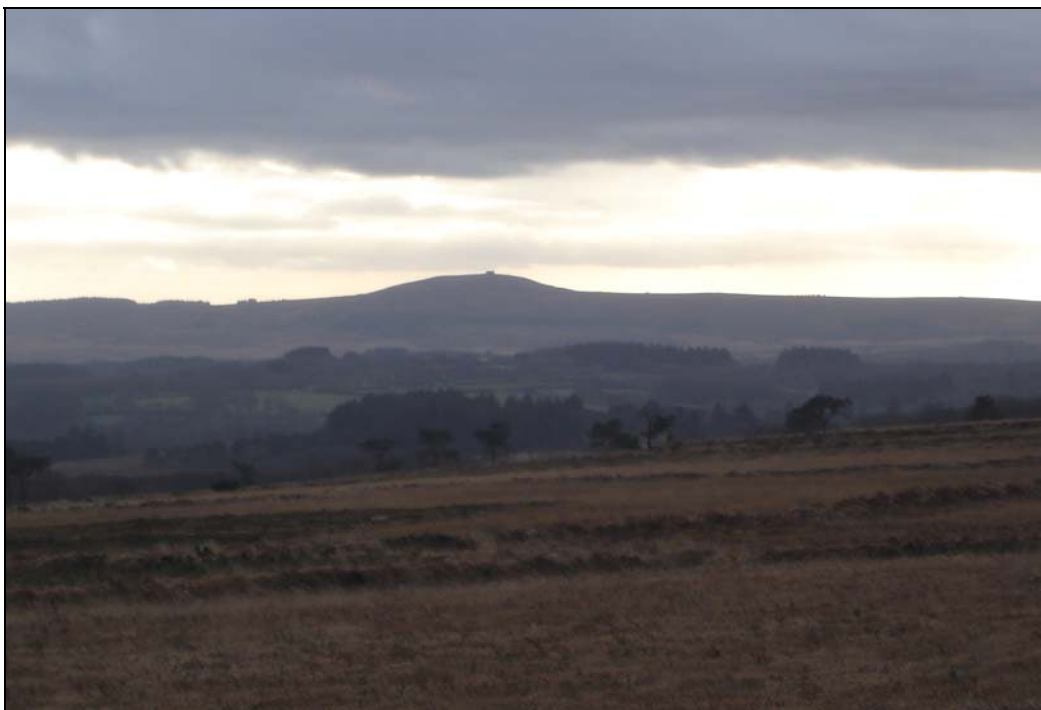
Photo 5 - L'instrumentalisation culturelle des reliefs : le Mont Saint-Michel de Braspart (ou Menez Mikel, 381 m), vu du Roc'h Trévezel, dans le Finistère.

À 1780 m d'altitude, à moins d'un kilomètre (et en vue) du sommet du mont Ventoux (1910 m), en Haute Provence calcaire, la stèle érigée à la mémoire du champion du monde de cyclisme Tom SIMPSON, où subsiste l'usage de déposer une pierre ou un bidon, 50 ans après l'accident.