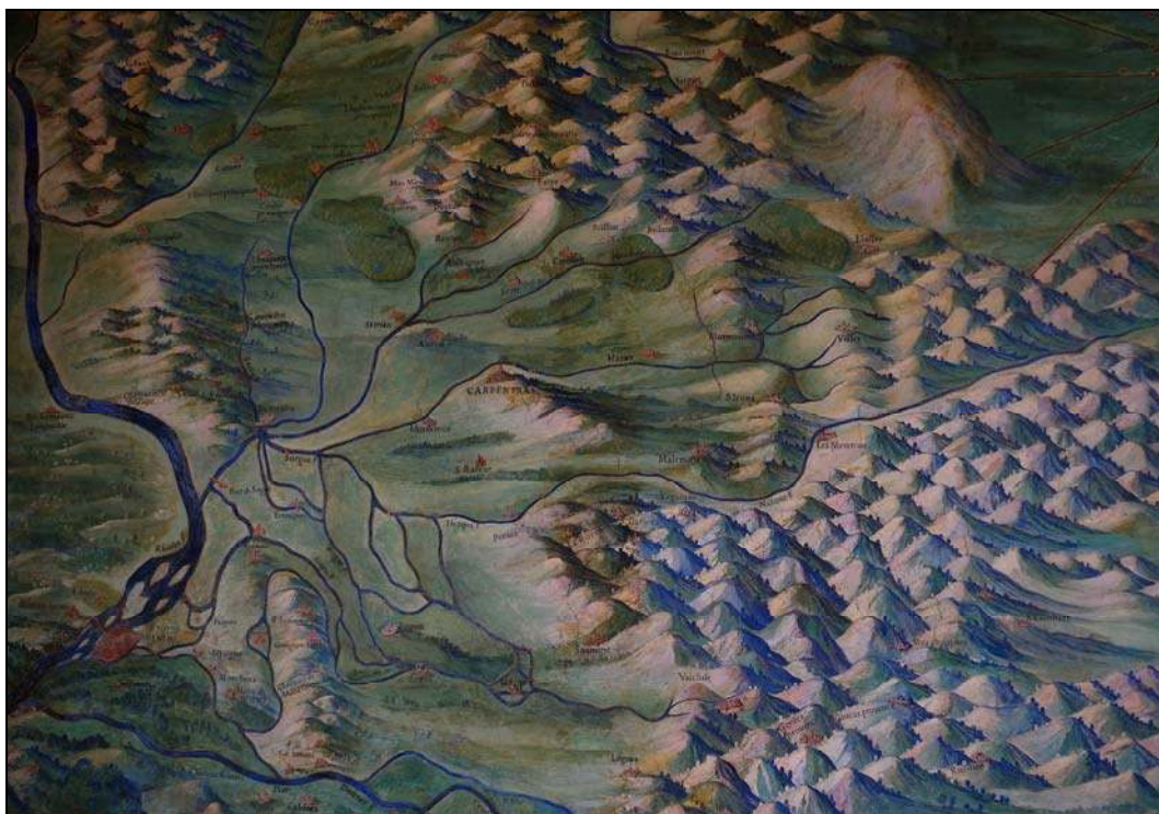
Photo 2 - L'appropriation des reliefs par leurs représentations iconographiques (et par leur désignation).

La représentation du bassin de Carpentras au pied du mont Ventoux et à l'ouest des monts du Vaucluse, de la vallée du Rhône et de celle de la Durance, reproduits en 1580 sur les fresques de la galerie des Cartes géographiques du musée du Vatican.