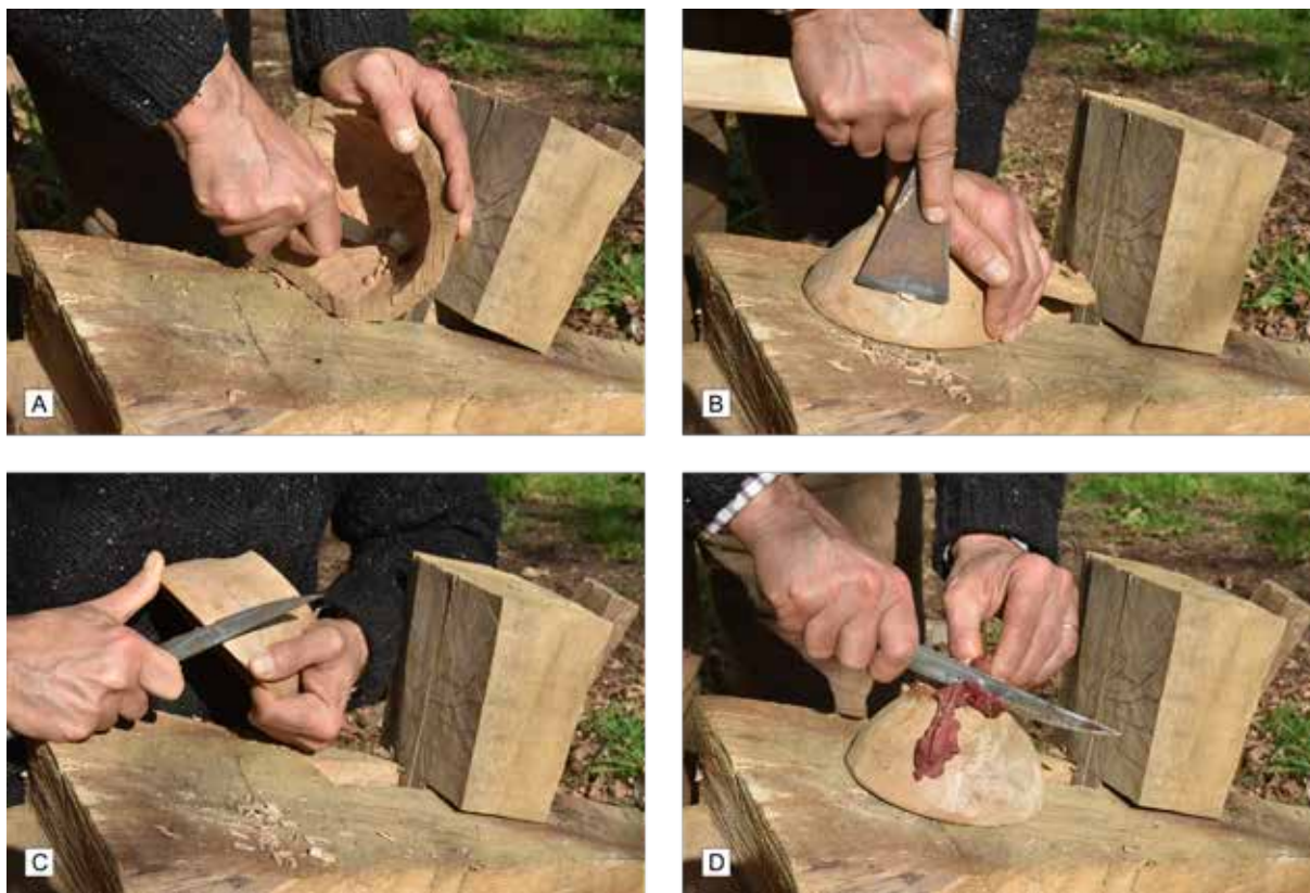
Fig. 428 : Chaîne opératoire pour la fabrication d'une écuelle. A - Évidage au couteau à évider après une mise en forme à la hache. B - Finition de l'extérieur à l'aide de la hache tenue comme un ciseau à bois en pression verticale directe. C - Finition du bord au couteau à lame droite. D - Utilisation du fond comme surface de découpe pour des besoins du quotidien.

de nourriture sur les minuscules plateaux de bois, sauf s'ils étaient employés comme "sous-verre", "sous-bol"... Il s'agit donc ici d'une représentation ou d'une évocation d'objets réels, plus grands et parfaitement fonctionnels ou d'objets dont on n'a pas compris l'utilisation.