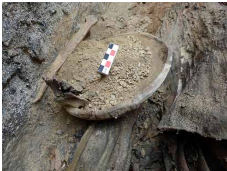
Fig. 420 : Ecuelle en mélèze 10003 et son couteau 10004 in situ sur le bras droit du défunt. Tombe ST 10.

L'objet 12014 (ST 12) est un autre témoin en mélèze ( Larix sp. ; fig. 422), très endommagé, de ce type de