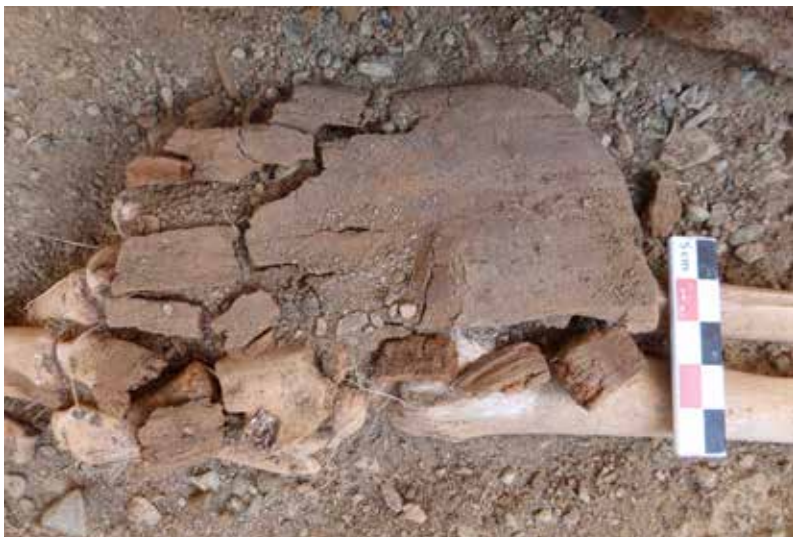
Fig. 423 : Fragments du tranchoir 11004 in situ posé sur la main droite du défunt. Tombe ST 11.

L'objet 16017 (ST 16) est taillé dans une très fine planchette de mélèze ( Larix sp. ; 0,3 cm) débitée sur quartier (plan radial). Sa longueur actuelle – 8,5 cm – est proche de ses dimensions initiales, alors que sa largeur – 4,5 cm – devait se rapprocher de 6 cm. Compte tenu de son extrême état de fragmentation, il n'a pas été possible d'observer de trace d'outil. Ce minuscule plateau était accompagné, comme 10003 et 14025, d'un petit couteau de bois ( infra ).