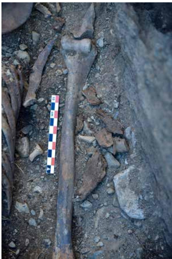
Fig. 422 : Fragments de l'écuelle 12014 in situ à proximité du bras gauche du défunt. Tombe ST 12.

complet, en revanche, l'angle d'inclinaison de son profil reste sujet à caution, d'autant qu'une déformation de ces petits éléments sous la pression des sédiments est évidente. Le diamètre minimum de ce récipient pourrait s'approcher de 11-12 cm dans le cas d'un bol. Dans le cas d'une écuelle, ses mensurations pourraient se rapprocher de celles de 10003 (~15 cm). Aucune trace d'outil ni de tour à bois n'a été vue sur ces petits fragments.