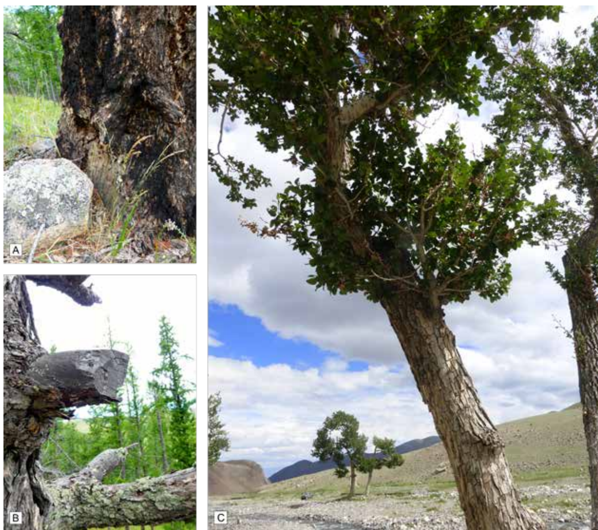
Fig. 419 : Espèces végétales et caractéristiques physiologiques des bois sélectionnés pour la fabrication de la vaisselle Bulan-Kobin. A - Pied d'un mélèze portant les traces d'un feu de forêt (Arkhangai, 2013). Les écuelles en bois de mélèze ont été façonnées dans le pied des arbres, là où le bois est, après les loupes, le plus madré, c'est-à-dire que son fil tourmenté limite les fentes lors du séchage et de l'utilisation de la pièce. Il réduit également les risques de fracture en cas de chute de l'objet. B - Branche de mélèze sectionnée à la hache (Arkhangai, 2013). Les branches comme les jeunes troncs de mélèzes et de pins étaient tronçonnés et fendus à la hache dans leurs parties de droit fil dépourvues de nœuds afin d'en tirer de fines planchettes destinées à la fabrication de tranchoirs ou de petits couteaux. C - Partie du houppier d'un peuplier dans la vallée d'ikh Khatuu (2014). À Burgast, un tranchoir a aussi été conçu dans une partie de tronc ou de branche de peuplier.

Ainsi à Burgast, cinq inhumations Bulan-Kobin étaient encore accompagnées de vaisselle de bois sur laquelle reposait un dépôt alimentaire (sacrum de mouton-chèvre avec parfois quelques vertèbres caudales). Cela ne signifie pas pour autant que seules cinq tombes contenaient des objets en bois : bien au contraire, au regard d'états de conservation très variables, allant d'un niveau excellent dans la tombe 10 jusqu'à un état de trace dans la ST 16, on peut supposer que l'ensemble des offrandes étaient déposées sur des supports de bois dont l'absence aujourd'hui tient à des conditions taphonomiques locales très diverses. Cette remarque sous-entend qu'il faut impérativement que des spécialistes du bois archéologique soient mobilisés sur le terrain afin de procéder à la fouille, aux observations puis aux relevés des objets ou de leurs traces sur place.