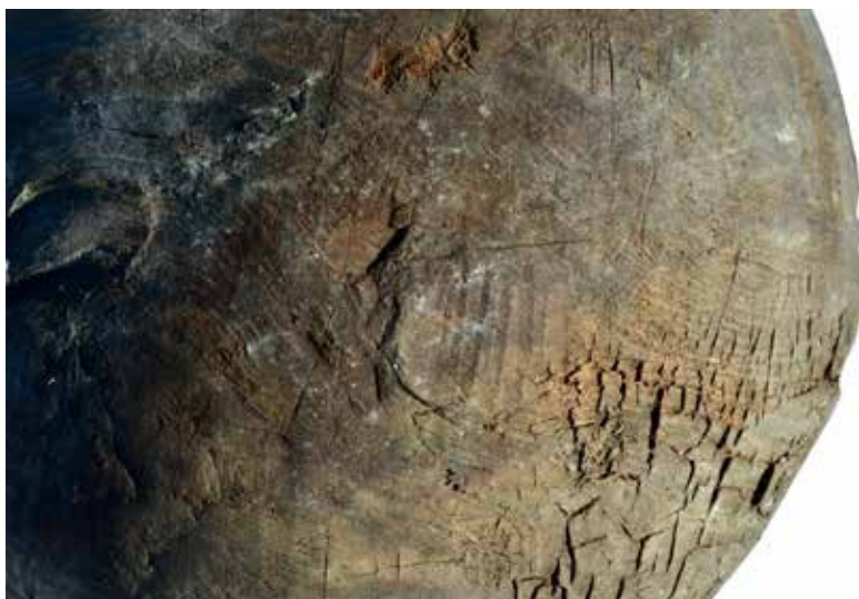
Fig. 421 : Détails morphologiques et techniques visibles sous l'écuelle 10003 (tombe ST 10). On remarque les motifs en forme de vagues des cernes de croissance, signe caractéristique d'un bois madré. À gauche, on devine l'emplacement d'un des trois pieds fracturés. Dans la partie centrale, on distingue l'emplacement d'un autre pied supprimé à l'aide d'un couteau. Sur l'ensemble de la surface, on retrouve de fines incisions pratiquées au couteau lors de l'utilisation du fond comme planche à découper.

tripode. En effet, les vestiges de ce bol se résument à quelques morceaux parmi lesquels on peut reconnaître une lèvre, des fragments de panse et un pied taillé dans un départ de branche de mélèze. Si le remontage de cette écuelle n'a pas posé de problème particulier pour déterminer qu'il s'agissait d'un profil archéologiquement