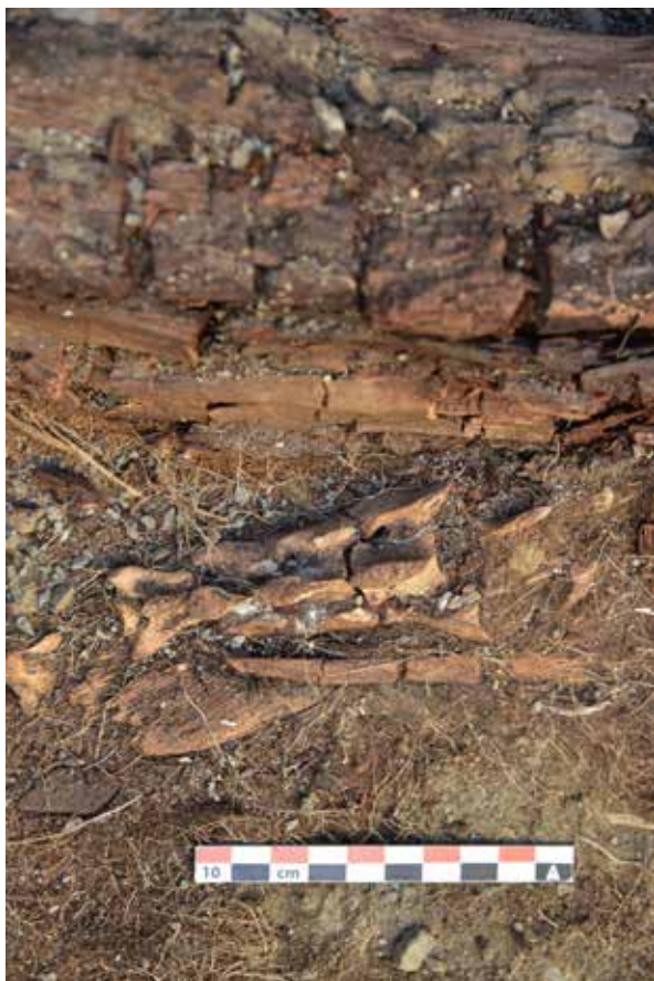
Fig. 425 : Tranchoir 16017 et son couteau 16018 in situ au-dessus de l'épaule gauche du défunt et sous les vertèbres caudales d'un capriné. Tombe ST 16.

cercle bien gravé sur le recto et d'une tentative avortée de cercle sur le verso. Un tranchant, également taillé au couteau, couvre la partie distale convexe. Le dos de la "lame" est rectiligne sur la majeure partie de sa longueur pour s'incurver vers la pointe. Ce couteau en bois avec son pommeau et son unique tranchant est la copie conforme de couteaux en fer contemporains, comme celui découvert dans la vallée de Katun à Cheremshanka, Maima VII-87 (Fédération de Russie ; Borodovsky et Oleszczak, 2012 ; cf. fig. 120). Dans ces exemples métalliques, les tailles sont bien les mêmes que pour 10005, mais les pommeaux se présentent sous la forme d'anneaux, comme il est d'usage d'en rencontrer dans la culture Xianbei (Soenov, 2017 ; Bobrov, Khudyakov, 2005). Dans notre exemple en bois, aucune perforation n'a été réalisée au risque de fragiliser le manche, mais l'intention du tracé circulaire était bien là.