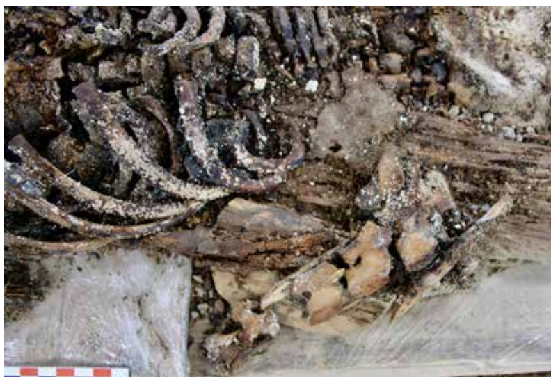
Fig. 424 : Tranchoir 14025 et son couteau 14026 découverts en laboratoire sur le côté gauche du défunt et sous les vertèbres caudales d'un capriné. Tombe ST 14.

L'objet 10004 (ST 10) est en mélèze ( Larix sp.) et mesure 16,5 cm de long pour une épaisseur de 0,6 cm. À mi-longueur, il est large d'1 cm alors que son extrémité distale dotée d'un « pommeau » s'élargit à 2 cm. Ce pommeau se présente sous la forme d'un disque taillé au couteau et constituant une butée. Il est décoré d'un