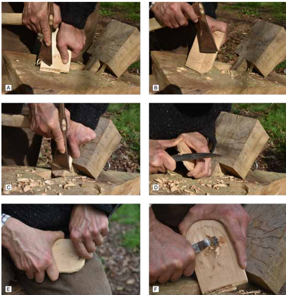
Fig. 427 : Chaîne opératoire pour la fabrication d'un tranchoir sur le modèle de 14025. A - Régularisation des bords à la hachette (à noter : l'outil est tenu comme un ciseau à bois en pression directe). B - Aplanissement des surfaces. C - Mise en forme et arrondis des angles à la hachette. D - Finition des bords au couteau. E - Tracé de la bordure à la pointe du couteau. F - Évidage du tranchoir au couteau à évider.