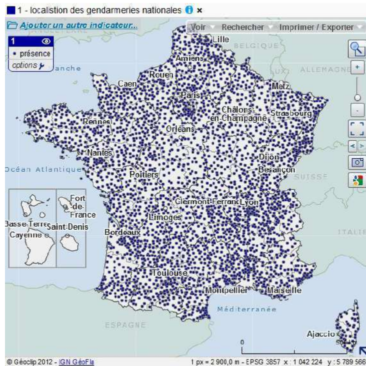
Mapa 1. Localización de las brigadas de gendarmería en Francia metropolitana, 2012

cubren el territorio bajo competencia de la institución, donde realizan un trabajo de policía judicial y administrativa polivalente. La red de brigadas es extensa y cubre territorios socialmente disímiles (ver mapas). Las brigadas tienen un mínimo de 6 gendarmes y se sitúan en cada cabeza de “cantón”, si bien durante las últimas décadas las brigadas situadas en cantones con poca población y actividad fueron cerradas, siguiendo directivas de reducción del gasto público. ¿Cómo se representan y cómo experimentan entonces los gendarmes los distintos territorios que vigilan, en los que deben no solo trabajar, sino también vivir?