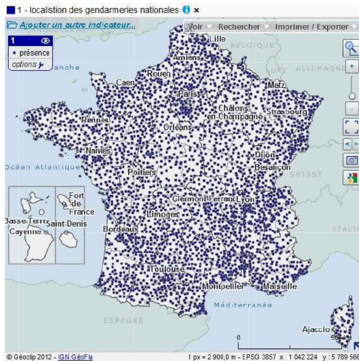
Mapa 1. Localización de las brigadas de gendarmería en Francia metropolitana, 2012

cubren el territorio bajo competencia de la institución, donde realizan un trabajo de policía judicial y administrativa polivalente. La red de brigadas es extensa y cubre territorios socialmente disímiles (ver mapas). Las brigadas tienen un mínimo de 6 gendarmes y se sitúan en cada cabeza de “cantón”, si bien durante las últimas décadas las brigadas situadas en cantones con poca población y actividad fueron cerradas, siguiendo directivas de reducción del gasto público. ¿Cómo se representan y cómo experimentan entonces los gendarmes los distintos territorios que vigilan, en los que deben no solo trabajar, sino también vivir?