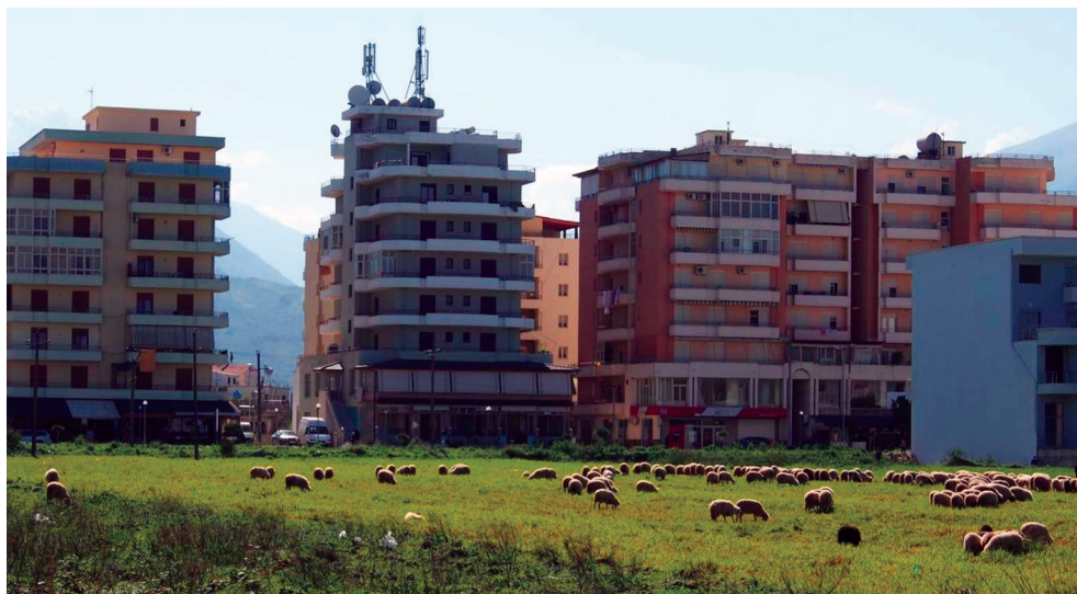
Figure 4. Troupeau ovin au pied des immeubles à Ori-kum (région de Vlora)