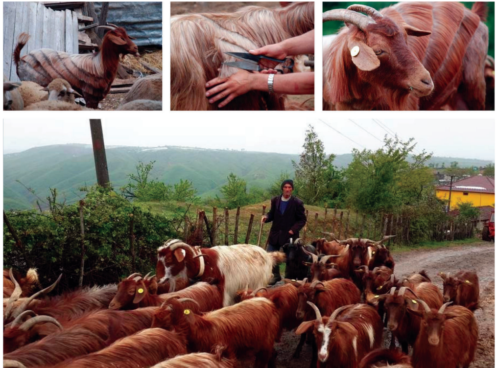
Figure 5. Troupeau de chèvres du Has à Helshan (Has, région de Kukës)