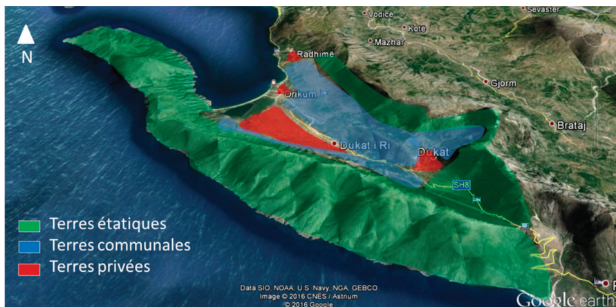
Figure 2. Représentation schématique de la localisation des trois régimes de propriété des terres à Dukat en 2016.