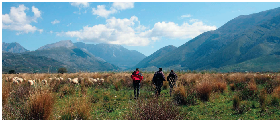
Figure 6. Plaine de Dukat (région de Vlora)

En Albanie comme dans l'ensemble montagnard des Balkans, le pastoralisme revêt une importance particulière pour des raisons multiples: environnementales, pour le maintien d'une agro-biodiversité menacée (races, variétés, pratiques), patrimoniales aussi pour le maintien de paysages culturels élaborés au cours des siècles. C'est aussi, comme les agricultures de terroir, un outil d'aménagement rural et de gestion des ressources. Ces systèmes sont à l'origine de produits de qualité et pourraient permettre d'éviter une complète désertification humaine de certaines zones, la perte des milieux ouverts, une afforestation non contrôlée propice aux feux de forêts. Il serait donc bon, pour l'Albanie comme pour les autres pays des Balkans, de rejoindre les réflexions, réseaux et programmes de recherche-action des pays européens, en particulier ceux de la Méditerranée qui sont actifs sur ces questions.