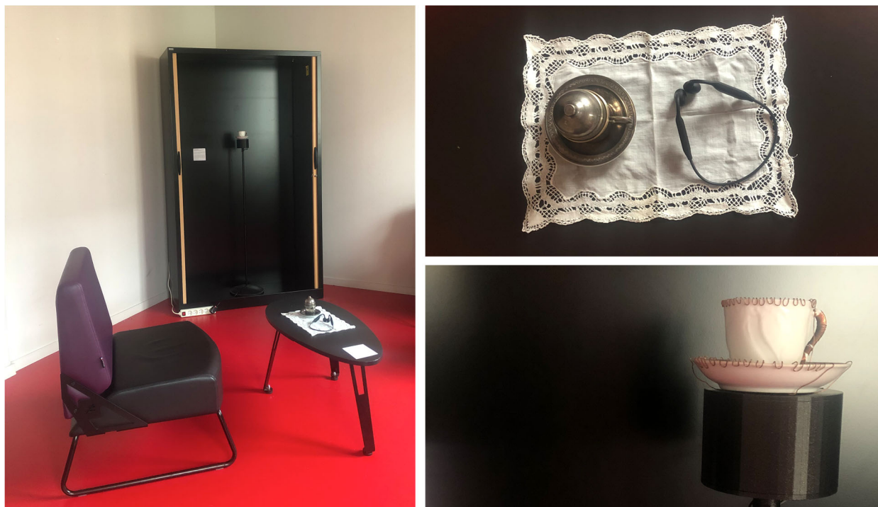
Figure 6. Les deux dispositifs dans le cadre de Drôles d'Objets

Nous avons été très marqués par la curiosité de chacun·e face aux dispositifs, de leur attention et de leur bienveillance aussi. Globalement, les participant·es ont semblé être engagé·es dans l'expérience, en passant plusieurs minutes à boire leur café par petites gorgées, absorbé·e·s par l'écoute, et laissant apparaître sur leurs visages des sourires, ainsi que des expressions de