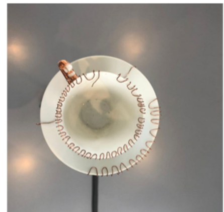
Figure 5. Tasse avec les capteurs capacitifs

Vidéo démo du dispositif 2 : https://vimeo.com/793814068