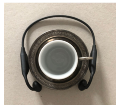
Figure 3. Tasse équipée prête à l'écoute.

Vidéo démo du dispositif 1 : https://vimeo.com/939049615