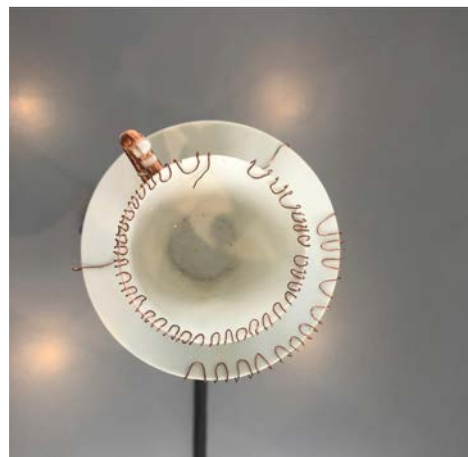
Tasse avec les capteurs capacitifs

Je considère ici que la tasse ressent le toucher. Pour cela, on utilise des capteurs capacitifs, qui s'inscrivent dans la tasse. J'ai réalisé une broderie de cuivre, en m'inspirant de la technique du Kintsugi et de l'art de la dorure de porcelaine. J'ai alors conçu un espace sonore à partir de sons enregistrés avec la tasse.