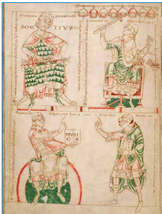
Fig. 1 : Cette enluminure du XI e siècle représente la pensée théorique tout en montrant ses filiations antiques. En haut à gauche, Boèce expérimente les proportions harmoniques sur le monocorde ; en face, la légende des marteaux de Pythagore : la main droite de Pythagore expérimente les proportions harmoniques en faisant sonner les cloches, la main gauche pèse les marteaux de différentes tailles, pour constater l'analogie entre les rapports des sons, le poids des marteaux, le volume des cloches. En bas, Platon et Nicomaque, les deux grandes autorités textuelles grecques de Boèce dans le De Musica , en geste de magister, le maître qui enseigne, au doigt levé pour indiquer la transmission des savoirs.

ca, comme toute chose, est, selon cette logique, en premier lieu Œuvre de Dieu.