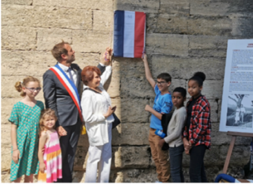
Dévoilement de la plaque par le maire et quelques enfants.