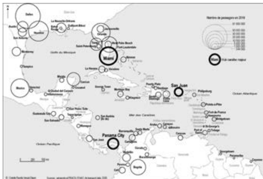
Figure 1 : Les trafics des principaux aéroports du Bassin caraïbe en 2019

L'évolution récente la plus spectaculaire au sein de la hiérarchie régionale est toutefois la percée fulgurante de Panama City, dont le trafic (16,6 millions en 2019) a été multiplié par 3,5 en 10 ans. Outre Miami, les lignes les plus fréquentées (plus de 500 000 passagers annuels) sur cette plate-forme desservent de grandes villes de la région : Bogota, Caracas (Maiquetía), La Havane et Cancun. Le réseau extrarégional de Panama City (plus d'une quarantaine de liaisons vers l'Amérique du Nord, l'Amérique du Sud et l'Europe), est également plus riche et plus diversifié que ses voisins. Autour de l'aéroport de Tocumen est prévu un ambitieux projet visant à la création d'un espace d'activité d'envergure mondiale et une vaste région urbaine.