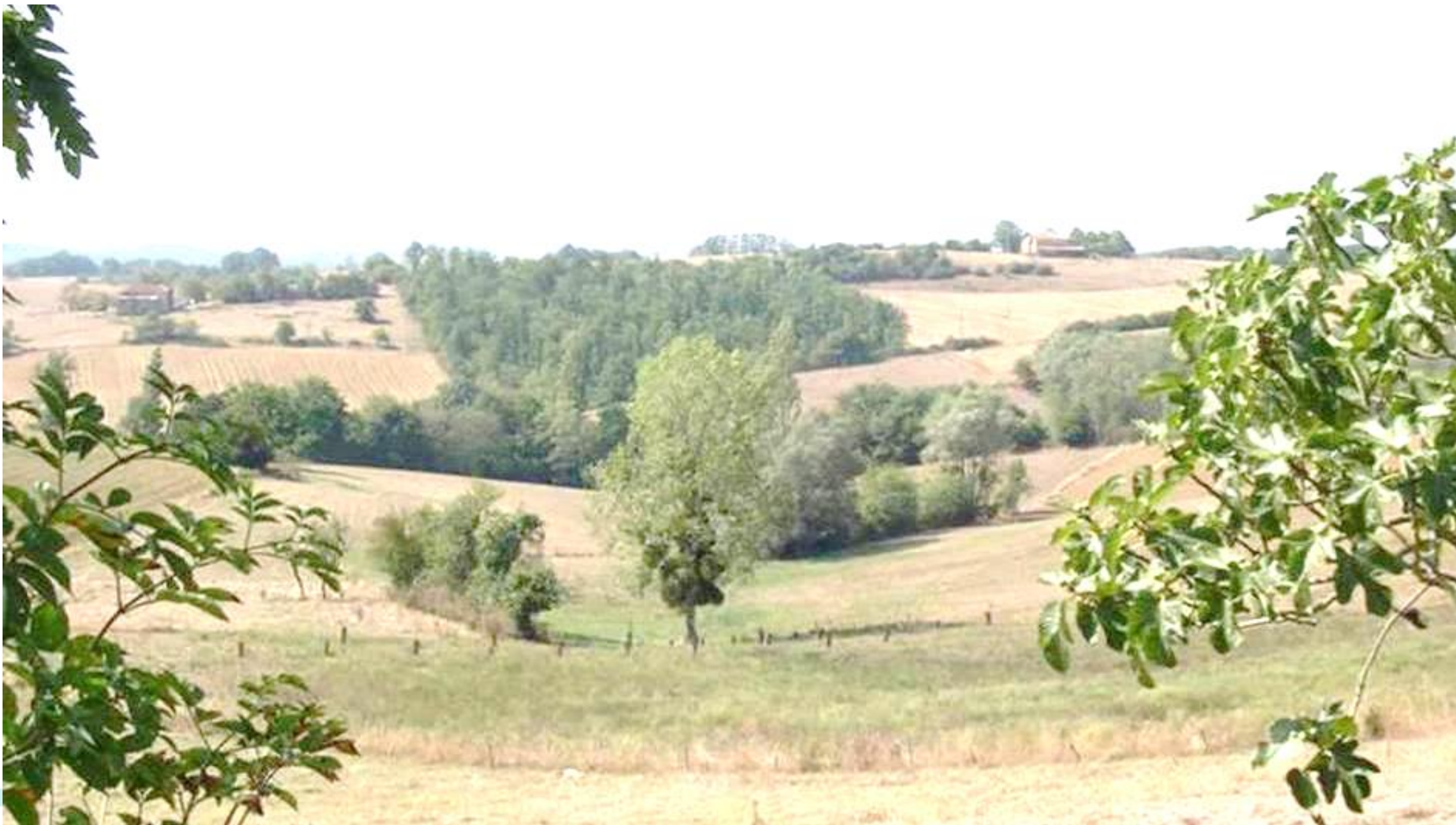
RZA Les éléments boisés dans les paysages agricoles : un levier pour la transition agro-écologique ? 13 mars 2024, Foix