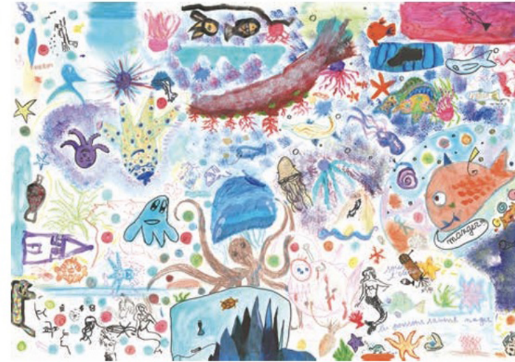
Œuvre collective, La biodiversité marine , 2023, crayons et feutres sur papier, 84 x 119 cm

Tout d'abord, l'œuvre est très riche, diversifiée et colorée. Elle traduit globalement une vision plutôt positive et émerveillée de la biodiversité marine. Les organismes représentés sont quasiment tous des animaux. Ce qui est frappant au premier regard, c'est la grande abondance d'animaux à tentacules : poulpes, méduses et anémones. Ceci traduit probablement la forte valeur affective et esthétique de ces organismes aujourd'hui. Les poissons sont également très présents, eux aussi sont très colorés et arborent des motifs variés. Parmi les animaux représentés avec une expression faciale, tous sont souriants, offrant à l'œuvre globale un sentiment de gaieté. Quelques prédateurs moins amicaux rôdent toutefois à travers le dessin : un requin, un poisson abyssal reconnaissable à l'organe lumineux au-dessus de sa tête, un gros poisson orange qui formule son appétit, ou