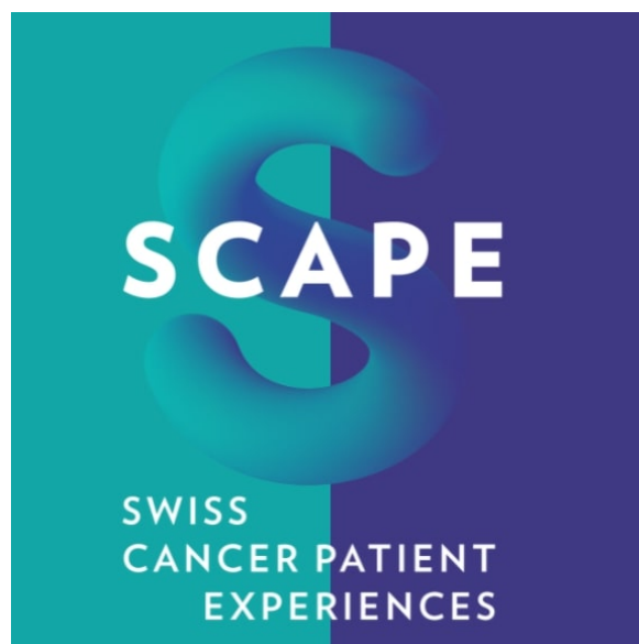
Figure 1 : Logo SCAPE

Il comporte également une question sur la satisfaction générale ainsi qu'un espace pour des commentaires libres et se termine par des questions sur l'état de santé et des caractéristiques socio-démographiques.