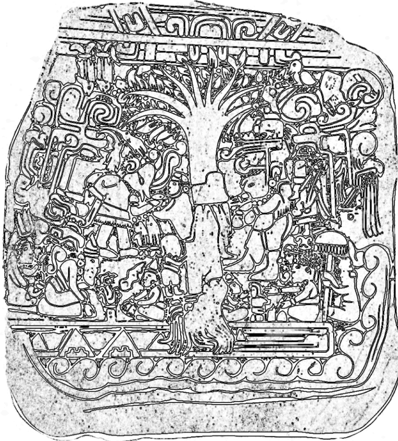
STÈLE 5 D'IZAPÁ, ÉGALEMENT CONNUE SOUS LE NOM DE PIERRE "ARBRE DE VIE". COMPOSÉE D'ANDÉSITE VOLCANIQUE. COMPREND 12 FIGURINES ANTHROPOMORPHES, 12 FIGURES ANIMALES, 25 OBJETS BOTANIQUES OU INANIMÉS, 9 MASQUES DE DIVINITÉS. ARBRE MAYA TZOTZIL - LA VISION DU MONDE : NORD = CIEL-DEMEURE DES DIEUX. TERRE = MONDE DES VIVANTS. SUD = RACINES - MONDE CHTONIEN, RÉSIDENCE DES MORTS (CF. LOW LEE, MARTINEZ 1982). ABATTRE UN ARBRE EST UNE MÉTAPHORE DE LA MORT PRÉSENTE DANS LES ANCIENNES TRADITIONS MÉSOAMÉRICAINES. LES PREMIERS ANCÊTRES ONT ÉMÉRGÉ DES ENFERS VERS LA TERRE À TRAVERS LES RACINES-MONDES D'UN ARBRE CEIBA. À LA MORT, L'ESPRIT GRAVIT LES BRANCHES DE L'ARBRE DE VIE VERS LE PARADIS CÉLESTE. LE CYCLE DE L'EAU SYMBOLISE LE CYCLE DE LA VIE - PRÉSENCE DES GLYPHES DES ÉTATS DE L'EAU D'EST EN OUEST. LE COUPLE PREMIER REPOSE AU PIED DE L'ARBRE. RÉGION DE SOCONUSCO, ÉTAT DU CHIAPAS, MEXIQUE.