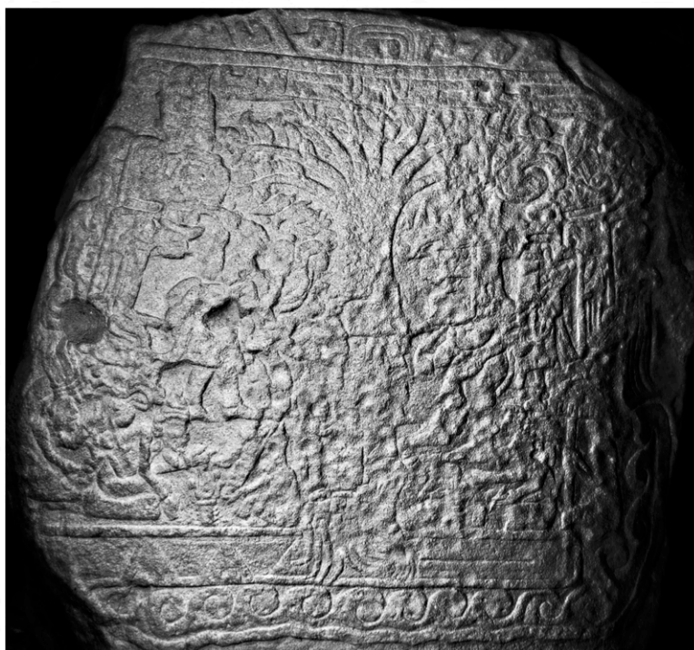
STÈLE 5 D'IZAPÁ, ÉGALEMENT CONNUE SOUS LE NOM DE PIERRE "ARBRE DE VIE". RÉGION DE SOCONUSCO, ÉTAT DU CHIAPAS, MEXIQUE. CULTURE IZAPÁ, PÉRIODE PRÉCLASSIQUE.