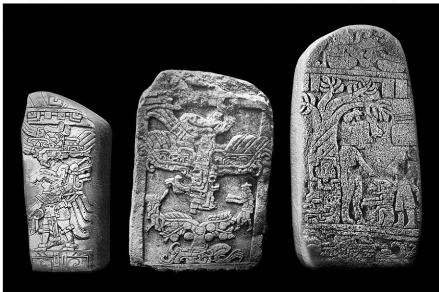
STÈLE 4, 2 ET 27 D'IZAPÁ. RÉGION DE SOCONUSCO, ÉTAT DU CHIAPAS, MEXIQUE. CULTURE IZAPÁ, PÉRIODE PRÉCLASSIQUE.

Parmi la multitude de dieux répertoriés, les mayas en adoraient quatre, dont chacun s'appelait Bacab ; ils formaient un groupe de quatre frères, fils de Itzamnáaj et Ix Chel , qui occupaient chacun un point cardinal du monde soutenant la voute céleste et étaient associés à une couleur et à une période calendaire. Dans l'iconologie maya, les cieux sont représentés par une bande céleste, c'est-à-dire une chaîne d'emblèmes célestes comprenant ceux du Soleil, de la Lune, de Vénus, entres autres astres, ou par le monstre cosmique. L'animal monstrueux encercle le sommet de l'autel 4 de Tikal , dont les côtés montrent quatre montagnes personnifiées sur lesquelles il repose, chacune perforée par une grotte à l'intérieur de laquelle siège la figure du Vieil Homme, c'est-à-dire le Seigneur Dieu NG, contenu par une