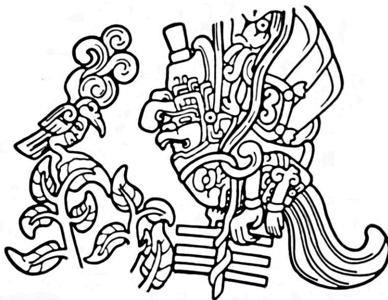
VUE DE DÉTAIL DU VUCUB CAQUIX. FACSIMILÉ DE LA STÈLE 25 D'IZAPÁ, ÉGALEMENT CONNUE SOUS LE NOM DE PIERRE "ARBRE-MONDE CROCODILE". RÉGION DE SOCONUSCO, ÉTAT DU CHIAPAS, MEXIQUE.

Le récit fabuleux retranscrit dans le Popol Vuh continue avec l'avènement du vrai Soleil Hunahpú qui, assisté de son frère Ixbalanqué (c.-à-d. la Lune), triompha de l'usurpateur Vucub Caquix . Selon le récit, le second astre fut soustrait du ciel par le Seigneur "Grand Oiseau" autrement nommé Hunahpú , à l'aide d'une sarbacane, qui agissait sous cette forme en tant qu' alter ego du dieu suprême Itzamnáaj adoré à l'époque classique (cf. Freidel, Schele, Parker, 1993, p. 70) ; la déité apparaît sur des stèles dès le premier siècle sur la côte pacifique du Chiapas, à Izapá . Dans ce cas, outre le caractère archaïque du motif, il faut retenir que le faux Soleil fut terrassé vers le bas astral par le Sol Invictus mésoaméricain.