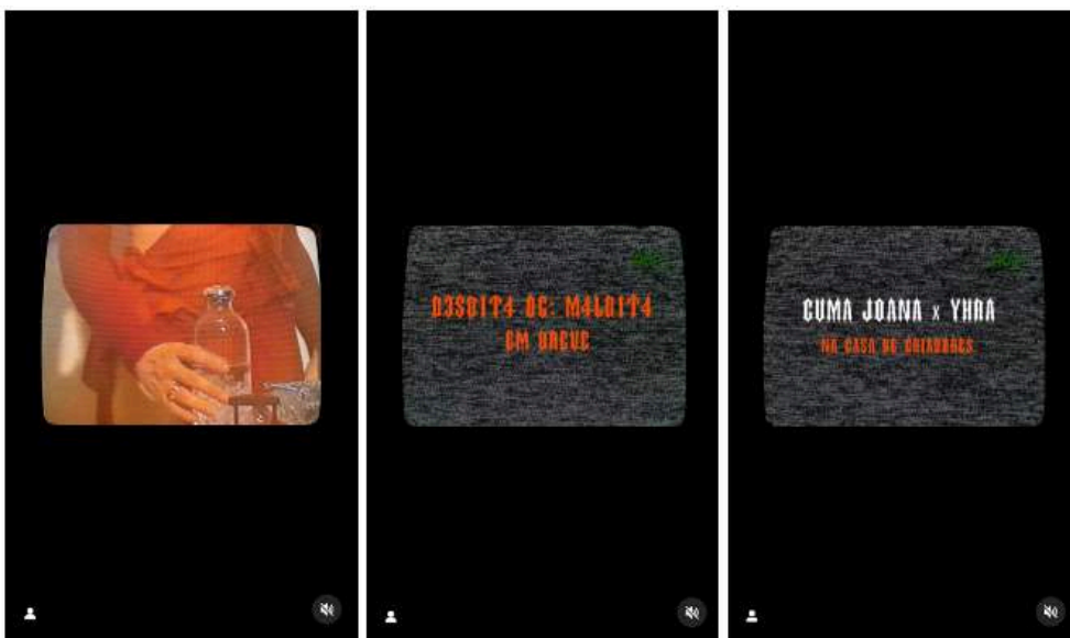
Figure 7. Séquence d'images tirées de la vidéo publiée par Guma Joana et Amem Yhra sur leur profil Instagram