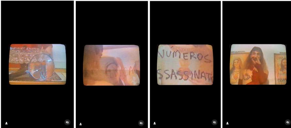
Figure 6. Séquence d'images tirées de la vidéo publiée par Guma Joana et Amem Yhra sur leur profil Instagram

gros plan sur le visage de la protagoniste comme pour l'affirmer comme nouvelle figure tutélaire à la place des deux icônes.