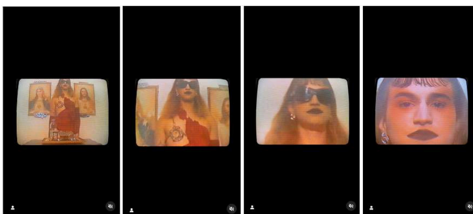
Figure 5. Séquence d'images tirées de la vidéo publiée par Guma Joana et Amem Yhra sur leur profil Instagram