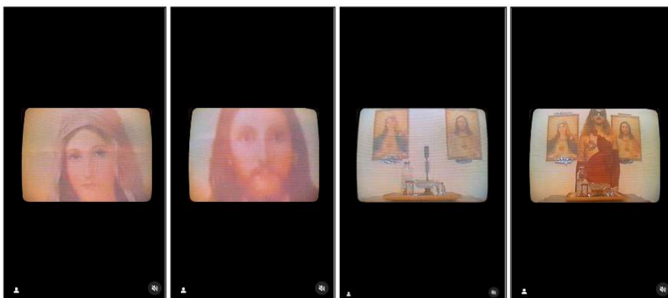
Figure 4. Séquence d'images tirées de la vidéo publiée par Guma Joana et Amem Yhra sur leur profil Instagram