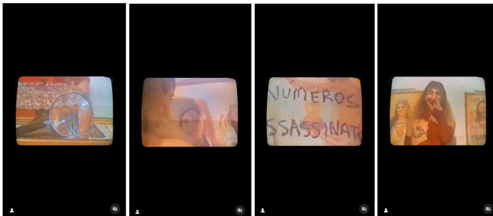
Figure 6. Séquence d'images tirées de la vidéo publiée par Guma Joana et Amem Yhra sur leur profil Instagram

gros plan sur le visage de la protagoniste comme pour l'affirmer comme nouvelle figure tutélaire à la place des deux icônes.