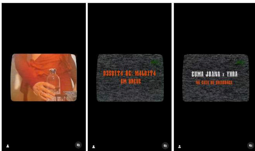
Figure 7. Séquence d'images tirées de la vidéo publiée par Guma Joana et Amem Yhra sur leur profil Instagram