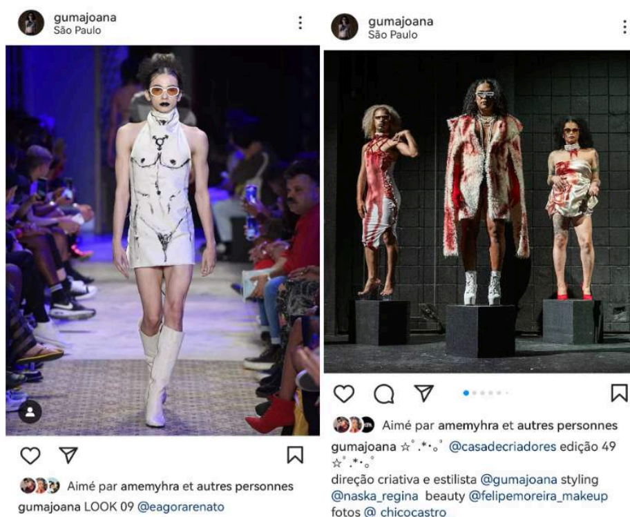
Figure 2. Deux captures d'écran du profil de Guma Joana avec des publications datées du 14 juillet 2022 (gauche) et du 9 février 2022 (droite)