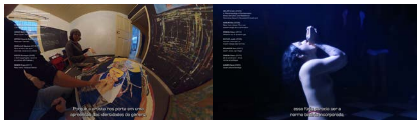
Figure 4. Composition de captures d'écran du court-métrage : exposition des références théoriques aux côtés des captations 360° réalisées in situ

jeu de re/cadrages cherche à exprimer visuellement et cognitivement au public le pouvoir de représentation que nous détenons dans cette situation.