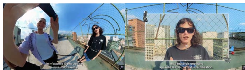
Figure 3. Composition de captures d'écran du court-métrage : transition du cadrage-sphère (captation 360° à gauche) au cadrage-fenêtre (captation au smartphone à droite)