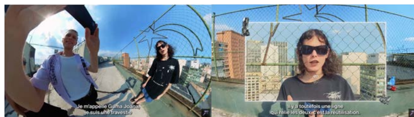
Figure 3. Composition de captures d'écran du court-métrage : transition du cadrage-sphère (captation 360° à gauche) au cadrage-fenêtre (captation au smartphone à droite)