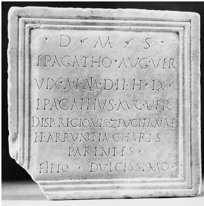
Fig. 1 : Cliché de l'inscription dans le catalogue de ventes aux enchères.

plus de 1300 individus s'étend du début du I er siècle apr. J.-C. au début du III e siècle 12 . Or, l'étude bien connue de J.-M. Lassère 13 indique que, sur les inscriptions païennes africaines, on peut constater l'absence d'une évolution très marquée de la paléographie pendant le II e siècle. Certaines épitaphes ont tendance à avoir un dessin cursif, mais beaucoup d'autres n'offrent guère de particularités et c'est ce que l'on constate en comparant notre inscription avec les autres épitaphes évoquées. Par conséquent, le seul indice clair ne permettant pas de dépasser la fin du II e siècle est la forme du G mentionnée plus haut et notre inscription daterait d'entre le règne d'Hadrien et la première période de Septime Sévère.