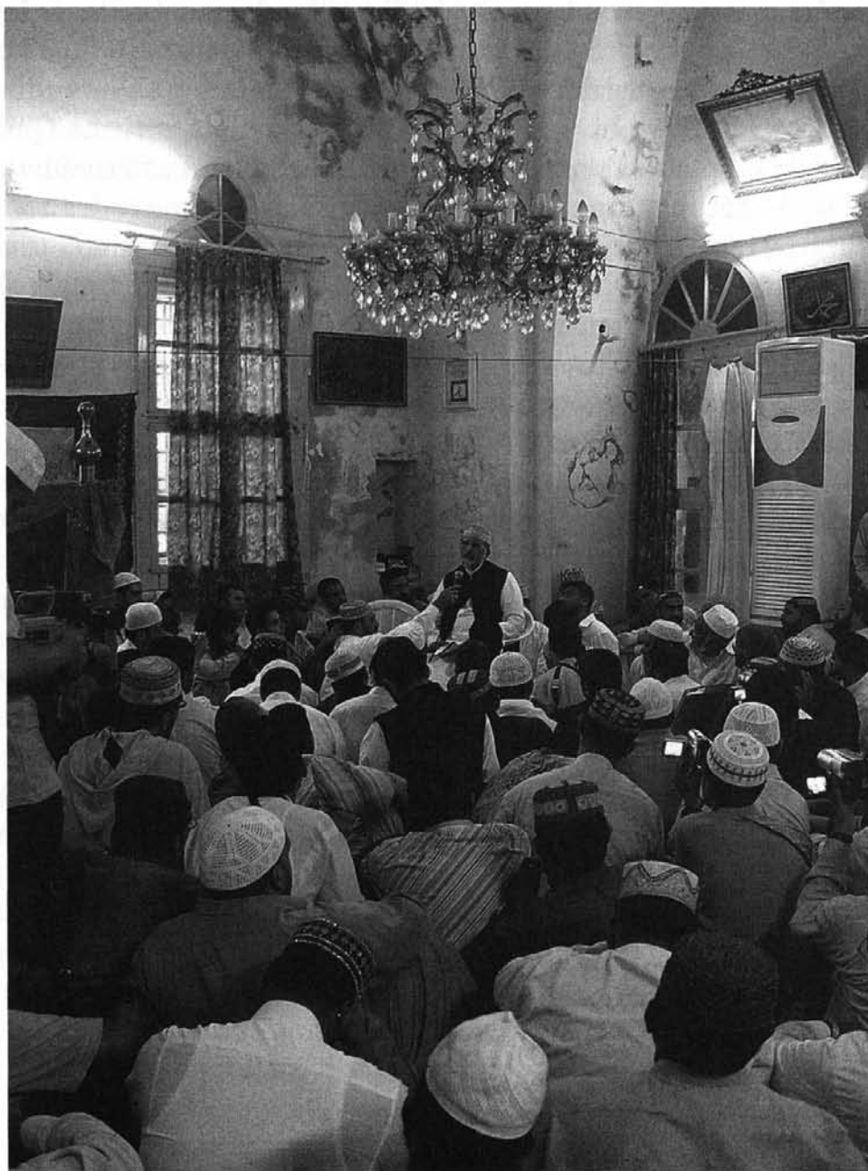
Photo 1 : Tahir ul-Qadri entouré de ses fidèles dans le sanctuaire de Abraham Bin Adham à Jebblé, Syrie

double proximité des awliya Allah 17 . Tahir-ul Qadri met en scène, en s'y identifiant, la dimension sacrificielle du retour du saint qui, après avoir été proche de Dieu, se tourne vers les hommes pour les guider.