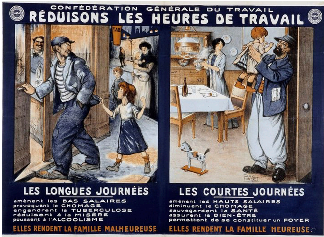
Figure 4 : Confédération Générale du Travail. Réduisons les heures de travail.