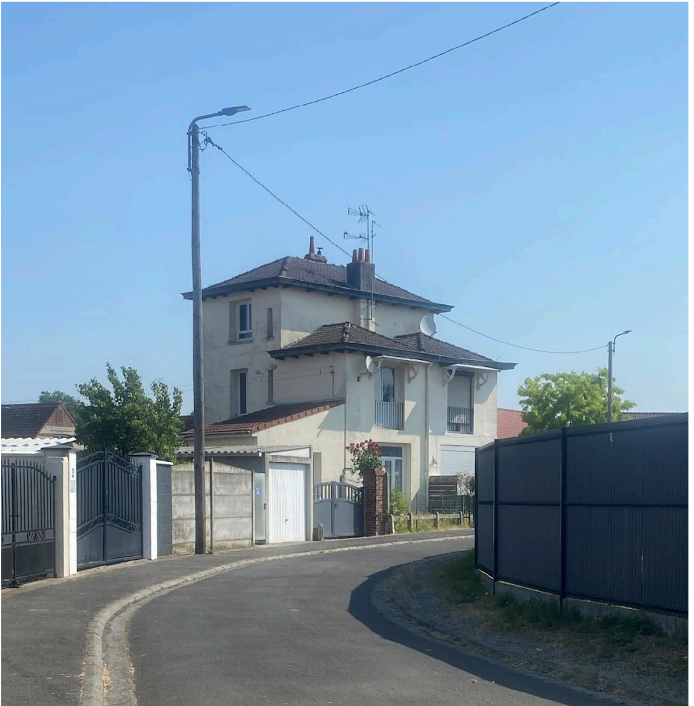
Figure 12 : Pavillon pour deux familles de la cité du Sana à Montigny-en-Ostrevent. juin 2023.