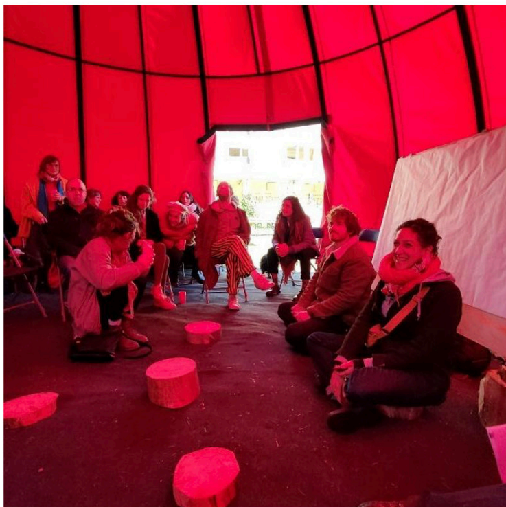
Figure 10 : Journées porte ouverte du sanatorium de Bergesserin en vue de la mise en place de la coordination du tiers-lieu, avril 2022.