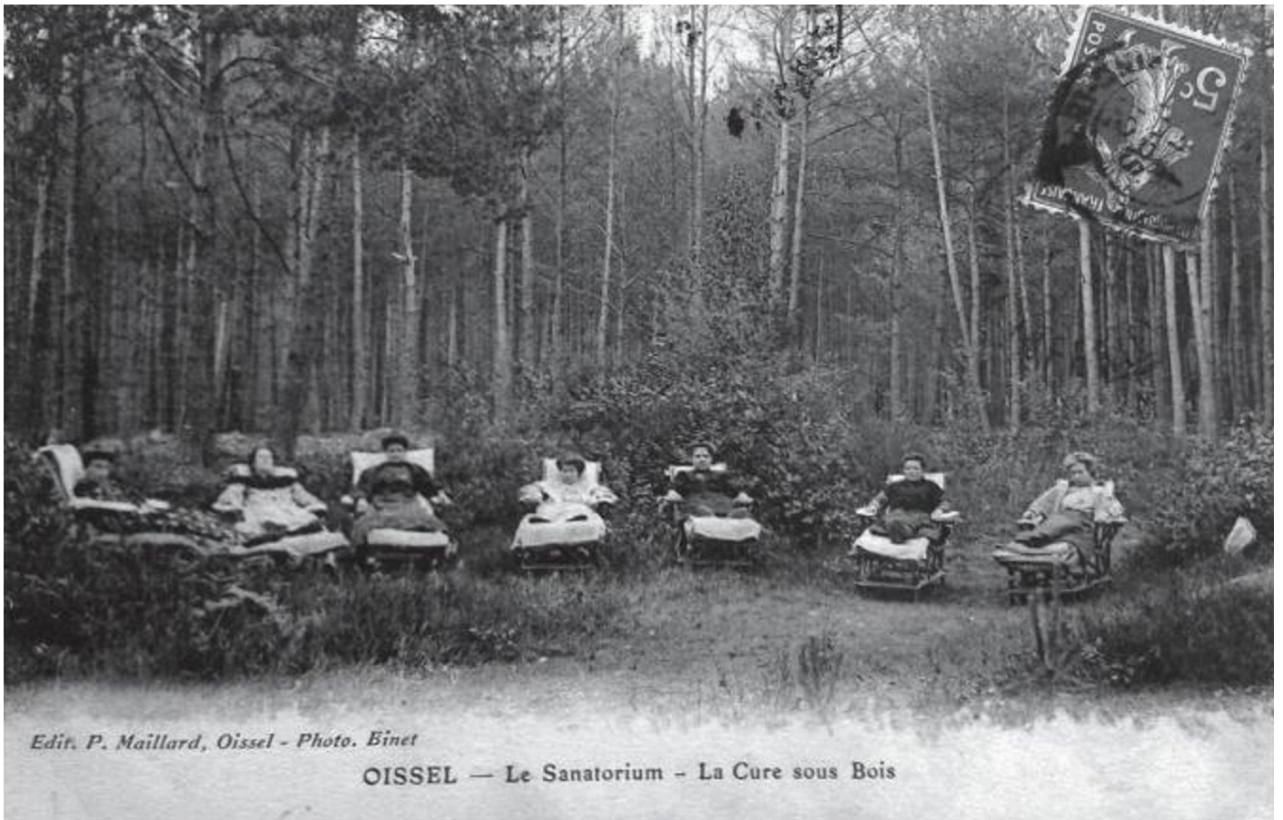
Figure 1 : Carte Postale : La cure dans les bois au sanatorium d'Oissel en 1910. (Henry, 2013)