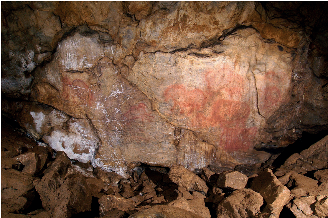
Fig. 3 – Grand panneau de la très sonore (7-8 échos) salle des Peintures de la grotte Kapova (Shulgan Tash, Oural). Sous ce panneau, au niveau du sol, à gauche et à droite du cheval en relief central, on peut voir deux niches sonores où « l’effet bison » est aisément obtenu. Fig. 3 – Main Panel in the very sonorous (7-8 echoes) Paintings hall, Kapova cave (Shulgan Tash, Urals). On the ground level, under the panel, at the left and the right of the embossed horse, we can see two very resonant niches in which “bison effects” are easily obtained.