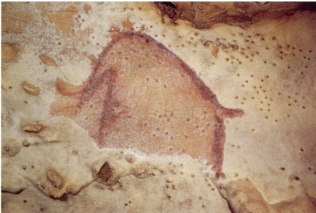
Fig. 1 – Grande Grotte d’Arcy-sur-Cure (Yonne). Le Mammouth diamanté de la Mezzanine , une des salles les plus sonores et les plus décorées de la grotte. Fig. 1 – Grande Grotte d’Arcy-sur-Cure (Yonne). Diamond-incrusted Mammoth in the Mezzanine , one of the most resonant and ornate locations in the cave.

faire suivant la qualité de la paroi, la meilleure acoustique privilégiant en revanche les peintures. Évidemment, ce ne sont pas des absolus, la liberté créatrice et artistique a toujours existé : on peut ainsi trouver des images, en particulier des petites gravures, dans des endroits tout à fait inattendus et, semble-t-il, sans rapport avec une qualité sonore.