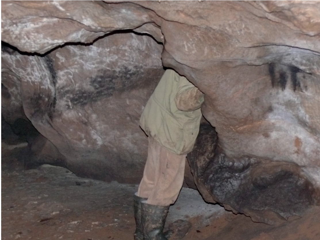
Fig. 2 – Grotte Kapova (Shulgan Tash, Oural), dans la Coupole, une niche à « effet bison ». Fig. 2 – Kapova Cave (Shulgan Tash, Urals), in the Dome Hall, a “bison effect” niche.