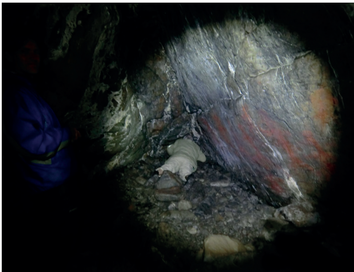
Fig. 4 – Grotte Solsemhula (Norvège). La procession sur la paroi de droite se dirige vers la niche au fond de la grotte ; dans cette niche, « l'effet bison » est aisément obtenu (cliché K. J. Sognnes).

tunnel, tandis qu'il n'y a ni image ni signe, ni avant ni après. Quelle explication peut-on donner à cela ? Est-ce un simple hasard ? Nous avons pu montrer que ces points rouges sont en rapport direct avec la résonance des boyaux où ils sont situés ; ils correspondent aux maxima de la résonance du boyau concerné. Cela a été montré dans la grotte du Portel, dans un tunnel d'une longueur de 10 m environ (Reznikoff et Dauvois, 1988), et dans la grotte d'Oxocelhaya, dans deux boyaux mesurant approximativement 6 m et 10 m de longueur (Reznikoff, 2002). Ces points rouges peuvent être repérés en progressant dans l'obscurité totale, tout en faisant des « hmmm » pour faire résonner le tunnel, et c'est ainsi qu'on les a découverts (Oxocelhaya) ou redécouverts (Portel). Arrivé au maximum de résonance, ce que l'on sent immédiatement, car ce maximum fait sonner tout le tunnel, on éclaire la paroi : le point ou la marque rouge est là. Comme il n'y a apparemment aucune autre raison pour que ces points soient situés où ils sont, alors que la correspondance avec les maxima de résonance est très précise, la conclusion, aussi étonnante soit-elle, est claire : les points rouges ont une signification sonore. Du moins est-ce le cas pour les grottes et particulièrement les boyaux que nous avons pu étudier.