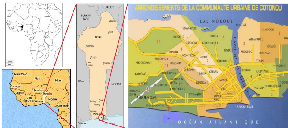
Figure 1 : de gauche à droite le Bénin en Afrique de l'Ouest et Cotonou, avec ses 13 arrondissements et les quartiers qui les constituent.

Nous avons choisi de travailler en milieu urbain où le problème de la distance géographique aux soins ne se pose pas ou peu en raison d'une offre de santé très présente mais également très hétérogène (public, privé, informel). En effet, la distance aux centres de santé est souvent avancée pour expliquer un recours important à l'automédication. Toutefois, une étude similaire en milieu rural sera nécessaire pour vérifier cette hypothèse.