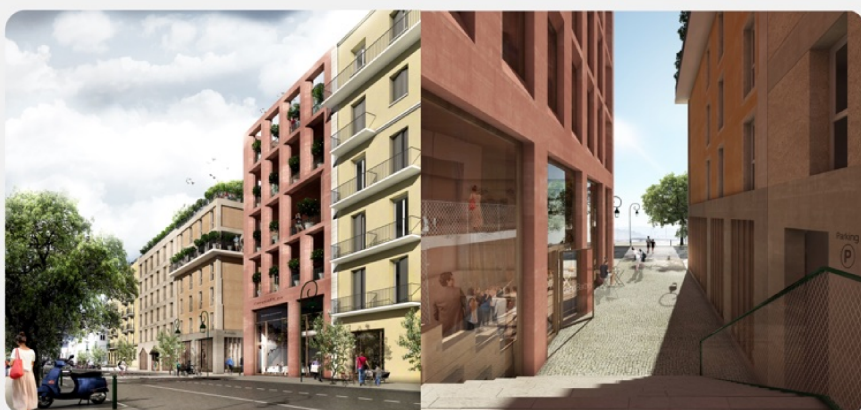
Simulation 3D des futurs locaux de GoodBarber (CampusPlex 2)

Contact docteur Email : plasson.loris@gmail.com Téléphone : 06 34 46 49 21