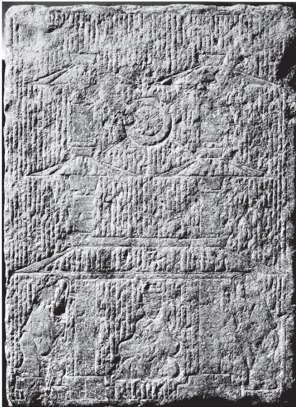
Fig. 1. – EO.2334.

Comme variante à l'hypothèse de la porte céleste, Jean-Marie Simonet suggère dans la fiche d'inventaire de cette dalle que les bâtiments de forme allongée représentés ici étaient des mâts en bois assurés au ting 亭, un immeuble à étages et sur pilotis qui aurait influencé l'évolution du stūpa indien vers la pagode chinoise 20 . Suivant l'identification du bâtiment comme un ting , il voit la figure centrale comme l'officier en charge du ting , le tingzhang 亭長, ou « chef de poste » 21 . Les ting , postes ou relais, étaient des unités territoriales administratives