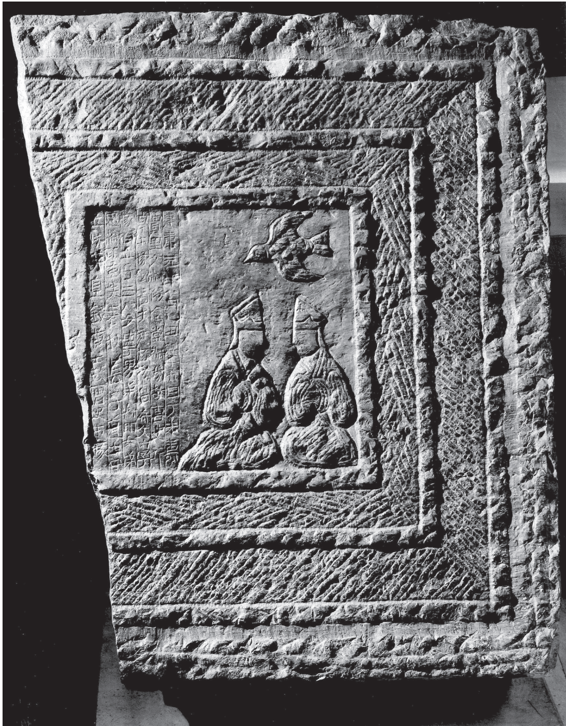
Fig. 2. – EO.2335.

inscriptions gravées sur bronze et sur pierre que des formes écrites au pinceau. L'inscription en six colonnes de 79 caractères en écriture cléricale porte les indications précises de date et de lieu (salle d'offrande de nourriture) et relate la carrière du défunt, Wen Shuyang. Le relief appartenait sans doute au bord droit d'une frise architecturale située dans la chambre désignée par l'inscription comme « salle d'offrande de nourriture » ( shitang 食堂). Cette pièce devait être attachée à la chambrette funéraire et demeurer accessible aux vivants. Les rares exemples qui nous sont parvenus de tels espaces sont les constructions en pierre assemblée de la famille Wu et celles du mont Xiaotang (Xiaotang shan 孝堂山), également situées dans la province du Shandong. La biographe du défunt se présente comme une liste de charges officielles portées par Shuyang et son neveu Daoshi, probablement responsable de l'érection du tombeau, et mentionne d'autres membres de la famille Wen.