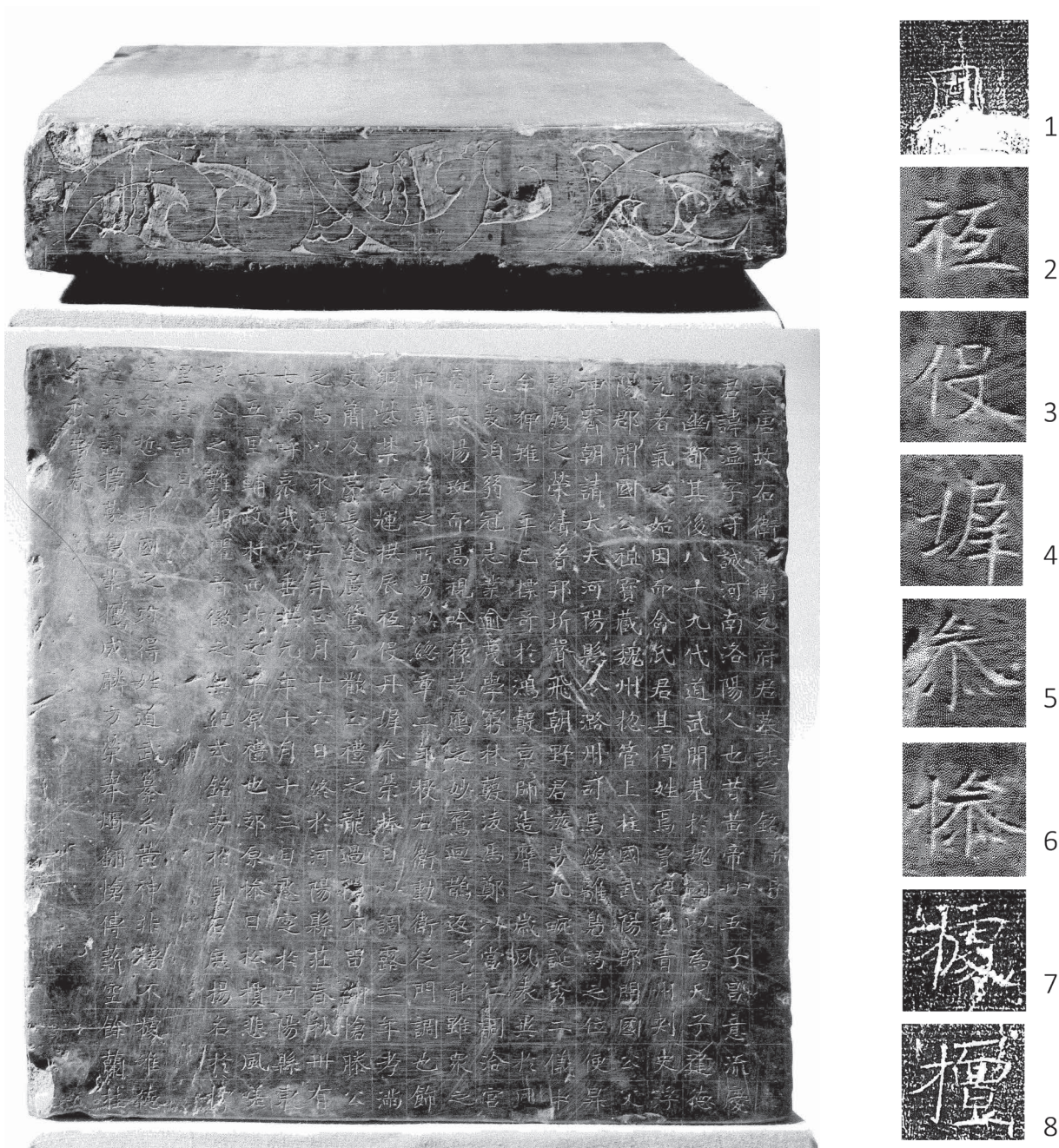
Fig. 6. – a) EO.2288; b) Caractères irréguliers ou endommagés (réf. 1 à 8).

Dans les temps anciens, l'Empereur Jaune avait vingt-cinq fils. Parmi eux se trouvait Chang Yi 昌意, qui partit pour la capitale de You 幽. Quatre-vingt-cinq générations plus tard, l'empereur Daowu 道武 fonda l'État de Wei. L'empereur, reconnaissant la valeur de l'origine comme source de toute vie, décida de nommer Yuan d'après ce principe. Par décret impérial, l'arrière-grand-père (de Yuan Wen) fut nommé administrateur de la préfecture de Qing 青 et Duc Fondateur de Dynastie de la province de Fuyang 浮陽. Son grand-père Baozang 寶藏 avait des responsabilités militaires au service de l'État et fut nommé Duc Fondateur de Dynastie de la province de Wuyang 武陽. Son père Shenji 神霽