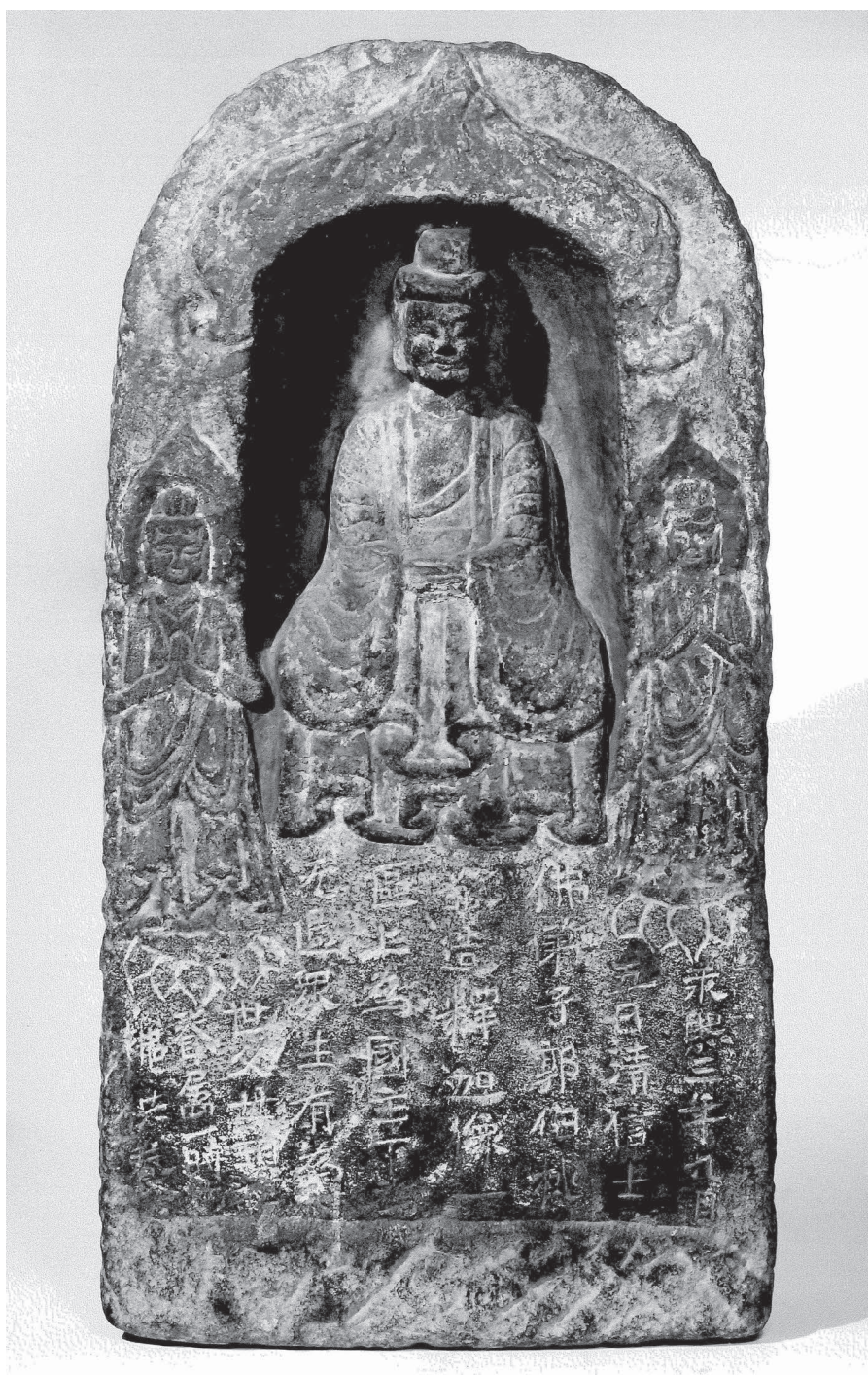
Fig. 3. – EO.2305.

classique. En effet, les inscriptions dédicatoires qui accompagnent les images bouddhiques, dont l'ensemble le plus fameux est celui des « Vingt œuvres de Longmen » ( Longmen ershipin 龍門二十品), furent étudiées et copiées sous forme d'estampages par des générations de calligraphes à la recherche de sources antérieures à l'avènement de la tradition classique sous les Tang au VIII e siècle et la standardisation de l'écriture régulière. Pourtant, abstraction était faite des formes sculpturales et architecturales (stèles picturales, grottes bouddhiques, etc.) pour lesquelles ces inscriptions votives ou dédicatoires avaient été originellement rédigées.