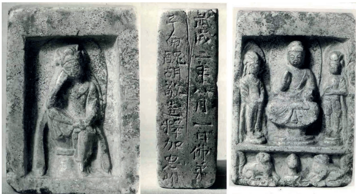
Fig. 4. – EO.2395.

Deux figures : l'une du Bouddha Sakyamuni, l'autre d'un bodhisattva en posture pensive.