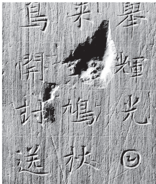
Fig. 7a. – CH.0266 (détail); Dans le coin inférieur droit de l'image, le cercle renfermant un signe en forme d'oiseau remplace le caractère 日 ri pour « soleil ».