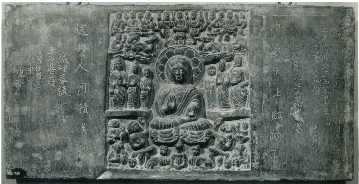
Fig. 10. – EO.0780.

La grande dalle présente, au centre, la figure assise d'un bouddha en abhaya mudra , flanqué de bodhisattvas et de moines. La figure centrale est surmontée d'une assemblée de danseuses portant de guirlandes, de musiciennes célestes ainsi que d'une paire de biches. Sous le bouddha, deux « barbares » esquissent un pas de danse de part et d'autre d'une figure portant un brûle-encens. Le bas-relief contient littéralement tout ce que l'on pourrait espérer d'une représentation bouddhique sous les dynasties du Nord, en particulier entre les VI e et VIII e siècles, mais les figures sont un peu trop joufflues, les coiffures et les robes peu convaincantes, et la présence des cervidés, étonnante. De plus, le sculpteur semble avoir laissé deux grandes surfaces de pierre vierges de part et d'autre de l'image, idéalement polies pour recevoir une inscription d'époque Qing, datée de 1839. Le format horizontal de la pierre se distingue étrangement des stèles picturales bouddhiques de l'époque. Deux anneaux en métal ont été ajoutés sur la tranche supérieure de la dalle, laissant penser qu'elle était suspendue dans un intérieur privé ou peut-être un temple. L'inscription tardive fait, ici encore, le récit de la découverte de cette pierre, et nous permet d'explorer les motivations du faussaire.