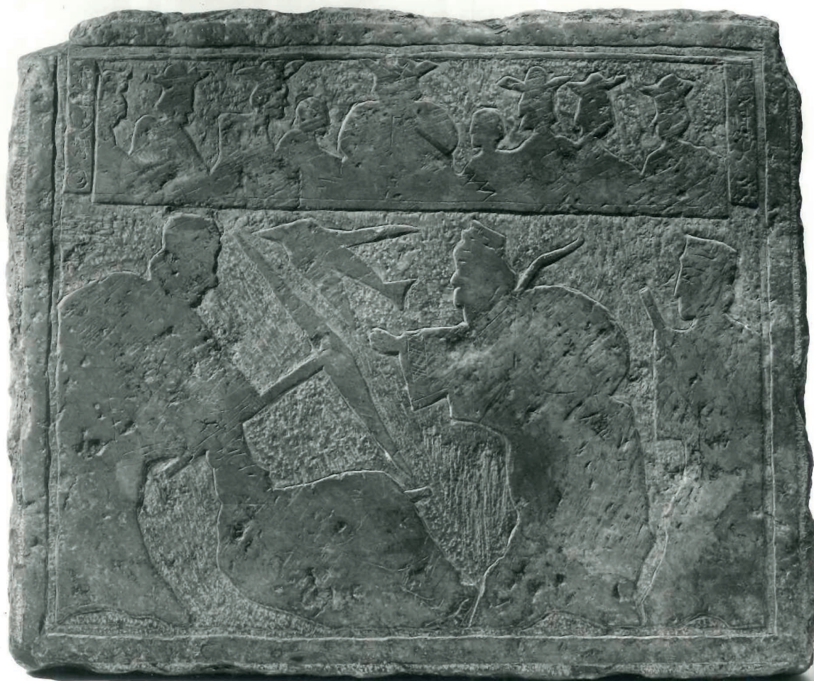
Fig. 8. – EO.2473.