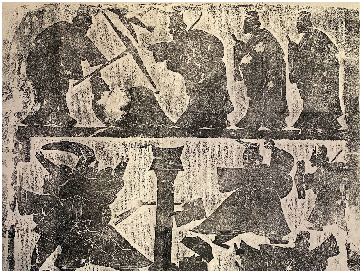
Fig. 9. – HB2023-1.

Avec une seconde dalle à l'authenticité douteuse, reproduite ici, nous quittons l'art funéraire des Han et le format de la « pierre gravée picturale » et nous dirigeons vers les « stèles sculpturales » bouddhiques.