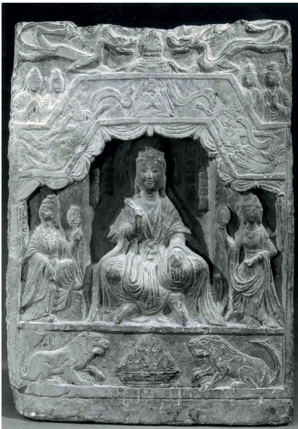
Fig. 5. – EO.2512.

du Shandong. L'omniprésence du dragon dans les reliefs de Qingzhou a été attribuée à un culte local intégré au culte bouddhique. Une autre interprétation pour la présence de dragons entrelacés sur des stèles picturales bouddhiques propose un parallèle avec les nagas indiens, représentés en surplomb de la figure du Bouddha. Le joyau sur son piédestal en trois marches occupe la place du stūpa « volant », caractéristique des stèles bouddhiques des Qi du Nord et des Zhou du Nord. La présence inhabituelle de personnages dans le registre supérieur, plutôt que dans le registre inférieur où se tiennent habituellement les donateurs et les intercesseurs, pose la question du statut de ces figures. Faut-il penser à des divinités, à une assemblée d'immortels, ou à des officiants taoïstes ?