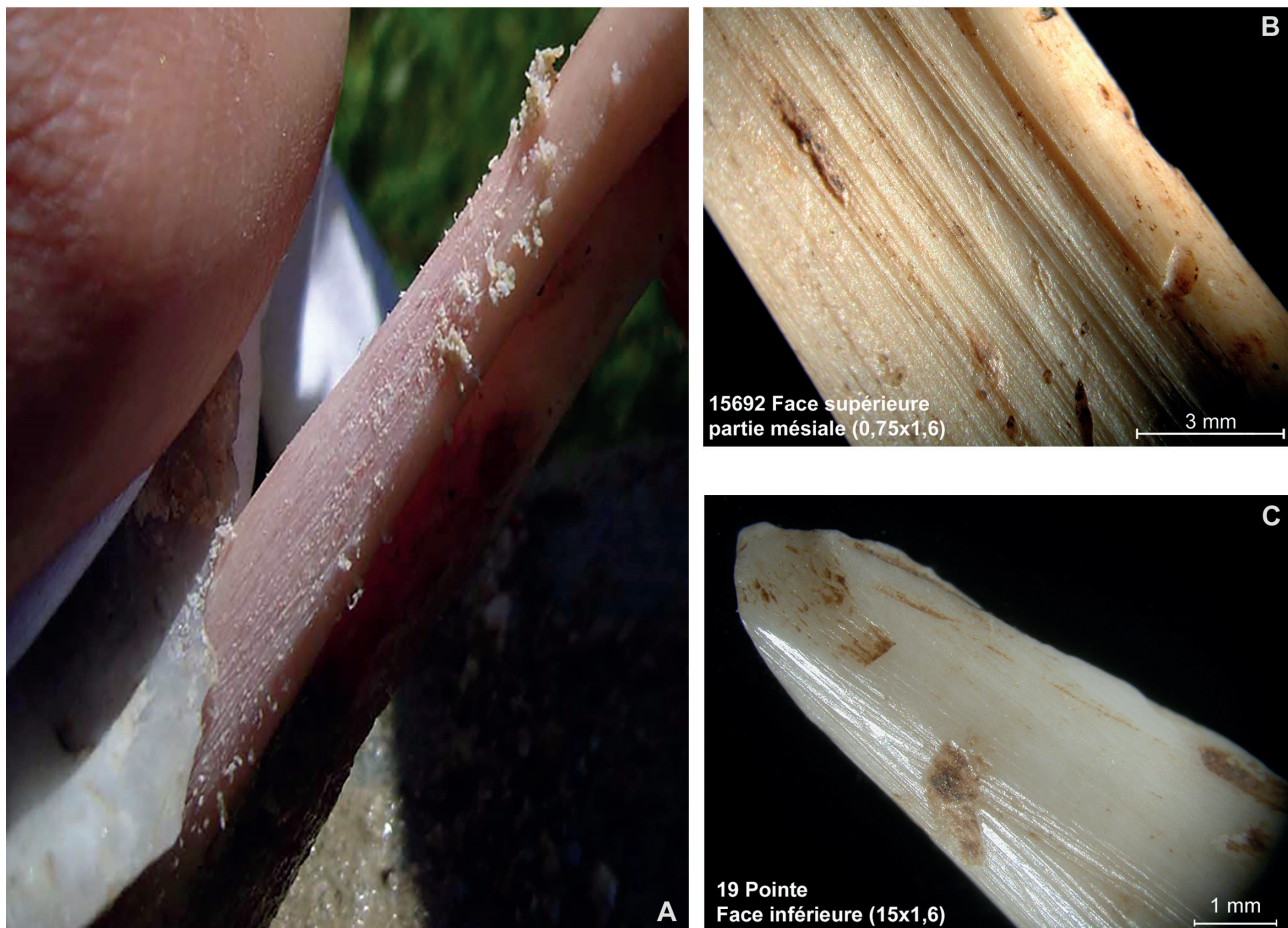
Fig. 2 – Raclage : A) mise en œuvre expérimentale du raclage avec un tranchant lithique sur éclat en quartzite manipulé à main nue et ajout d'eau, aperçu de la dégradation du tranchant lithique par ébréchure, des stries en cours d'impression sur l'os et des paquets de poudre ou de petits copeaux qui résultent de l'action (cliché M. Lichardus-Iltten) ; B) traces de raclage de façonnage du corps d'un outil pointu, site de Cuiry-lès-Chaudardes (Aisne, France ; cliché I. Sidéra) ; C) traces de raclage de raffûtage d'une pointe, site de Beaumont (Yonne, France ; cliché I. Sidéra).

Fig. 2 – Scraping: A) Experimenting scraping with a lithic cutting edge on quartzite flake handled with bare hands and addition of water, overview of the degradation of the lithic cutting edge by chipping, the striations being impressed on the bone and the packets of powder or small chips that result from the action (photo M. Lichardus-Iltten); B) scraping marks on the body of a pointed tool (shaping), site of Cuiry-lès-Chaudardes site (Aisne, France; photo I. Sidéra); C) scraping marks on a tip of a pointed tool (resharpening), site of Beaumont (Yonne, France; photo I. Sidéra).