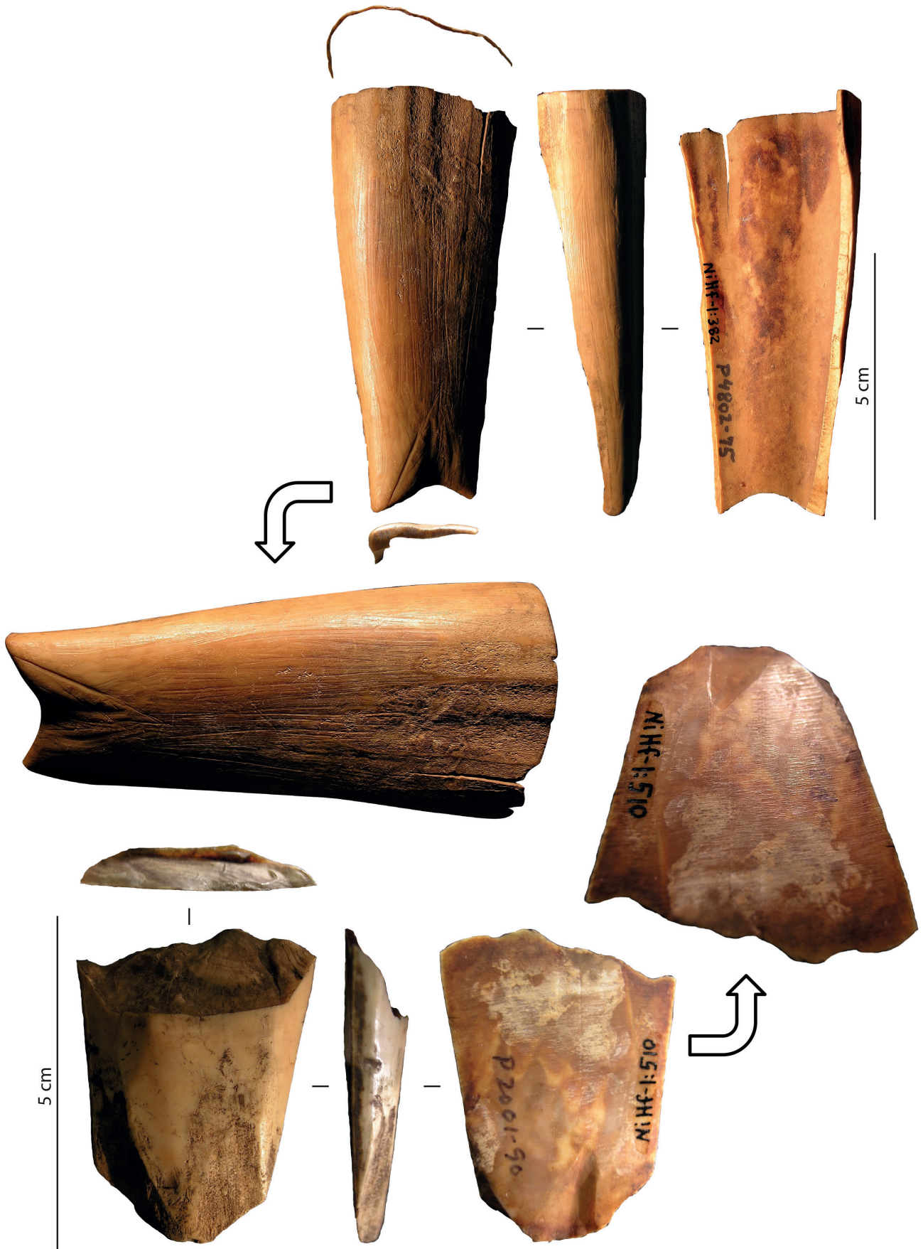
Fig. 4 – Traces de raclage (haut) et d'abrasion (bas) en contexte arctique. Fig. 4 – Scraping (up) and abrading (bottom) marks in Arctic context.