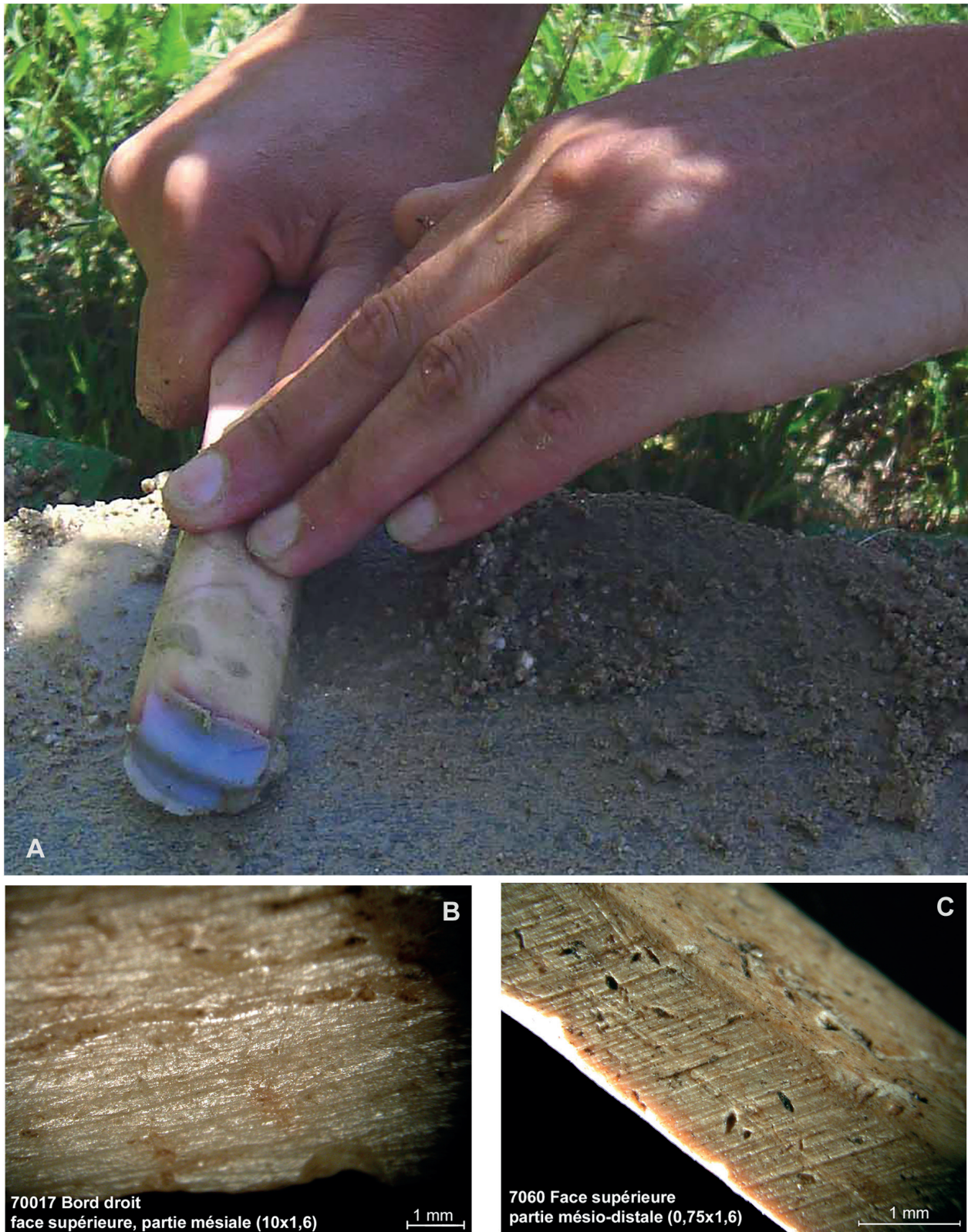
Fig. 1 – Abrasion : A) mise en œuvre expérimentale sur polissoir à plage ample avec sable et eau, aperçu des gestes (cliché M. Lichardus-Itten) ; B) stries d'abrasion longitudinale sur un outil pointu néolithique, site de Cuiry-lès-Chaudardes (Aisne, France ; cliché I. Sidéra) ; C) stries d'abrasion transversale oblique sur un outil pointu néolithique, site de Cuiry-lès-Chaudardes (Aisne, France ; cliché I. Sidéra).

Fig. 1 – Abrasion: A) Experimenting abrasion on a wide area polisher with sand and water and overview of the gestures (photo M. Lichardus-Itten); B) longitudinal abrasion striae on a pointed tool, site of Cuiry-lès-Chaudardes (Aisne, France, photo I. Sidéra); C) oblique transverse abrasion striae on a pointed tool, site of Cuiry-lès-Chaudardes (Aisne, France, photo I. Sidéra).