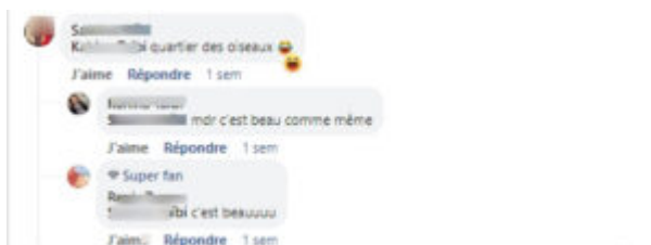
C18 - chaîne de commentaires n°18

Des noms et des discours sur le web social. Éléments d'analyse plurielle des discours toponymiques de la communauté discursive par le deuxième utilisateur, confirmé par le premier, estompe le caractère saugrenu de ce nom de quartier en lui attribuant de la beauté.