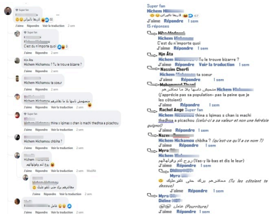
C19 – chaîne de commentaires n° 19