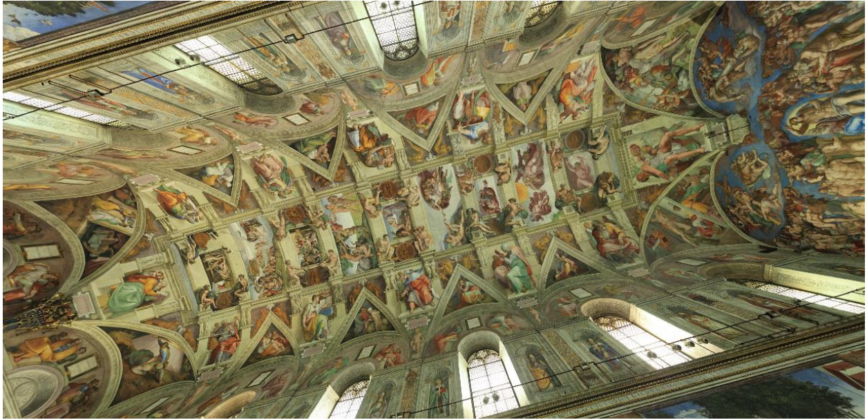
Les fresques de la Chapelle Sixtine

nous rendre compte de l'analogie frappante entre cette fresque et la photographie insérée sur la Une de Libération .