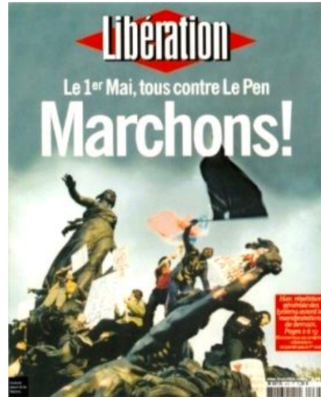
Une de Libération (30 avril 2002)

La photographie fut prise par Guillaume Herbaut, lors des manifestations anti Jean-Marie Le Pen, président du Front National.