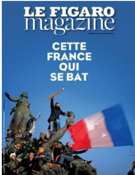
Une du Figaro Magazine (13 janvier 2015)

internationales et de renfermer une intericonicité avec les œuvres de Delacroix et de Schnetz, nous remarquons que c'est une reproduction à l'identique de la Une de Libération du 30 avril 2002, titrée « Le 1 er mai, tous contre Le Pen, Marchons ! ».