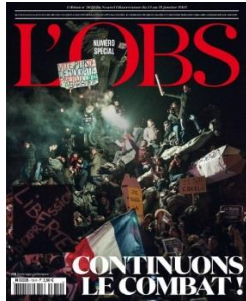
Une de L'OBS (14 janvier 2015)

Tout comme la prise de Mahé, il s'agit d'une contre plongée qui met en valeur la foule et la situe en position de domination, ce qui induit ainsi une composition pyramidale composée de bas en haut, qui renferme différents plans lui prêtant un aspect de profondeur.