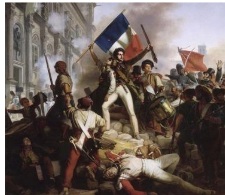
Le combat devant l'hôtel de ville, Jean-Victor Schnetz (1834)