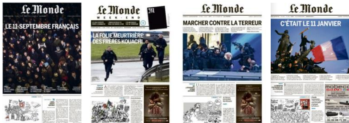
Unes du Monde du 9, 10, 11-12 et 13 janvier 2015

Ou encore l'adaptation des Unes du Monde du 9, 10, 11-12 et 13 janvier 2015 ;