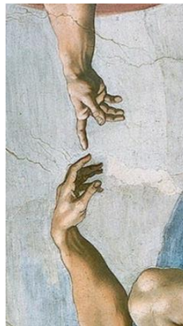
Rapprochement entre la Une de Libération du 17-18 janvier 2015 et La création d'Adam , 1508 de Michel Ange