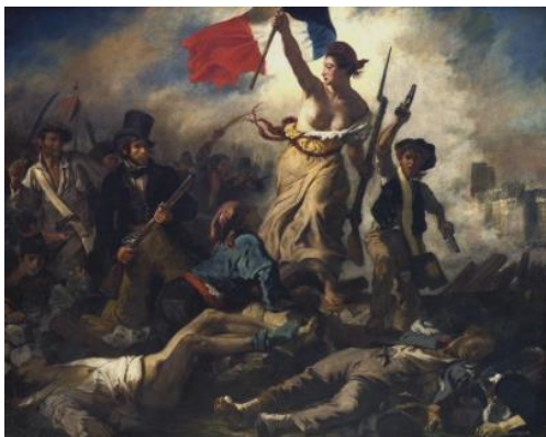
La liberté guidant le peuple, Eugène Delacroix (1830)

Une autre référence datant de la même période peut aussi être évoquée, c'est l'œuvre de Jean-Victor Schnetz, « Le combat devant l'hôtel de ville », peinte en 1834.