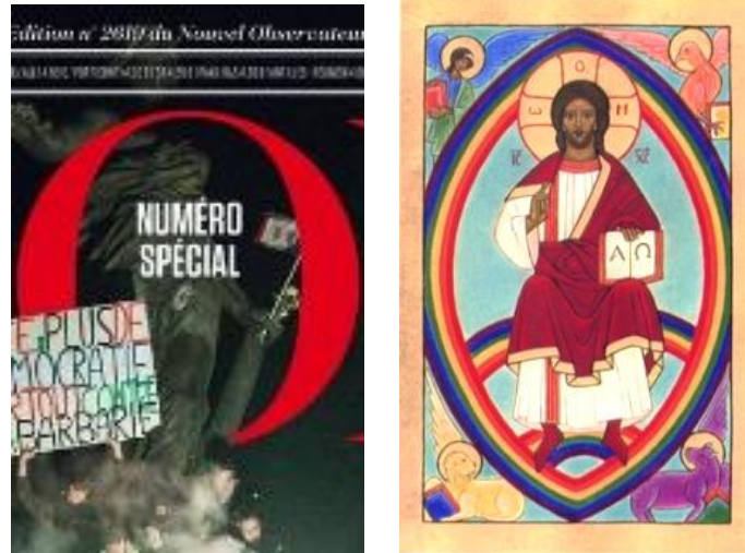
Le O de L'OBS en forme de mandorle enveloppant la Marianne

Dans la mise en page de sa couverture, L'OBS fait en sorte que son logo fasse partie de la scène.