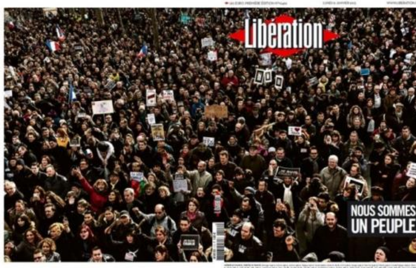
Une de Libération du 12 janvier 2015

Nous pouvons prendre l'exemple de Libération du 12 janvier 2015.