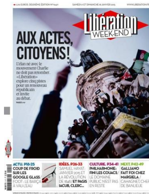
La Une de Libération du 17-18 janvier 2015

Une semaine après la marche républicaine, Libération insère dans sa Une du 17-18 janvier 2015, une contre plongée de la foule, toujours avec une structure pyramidale.