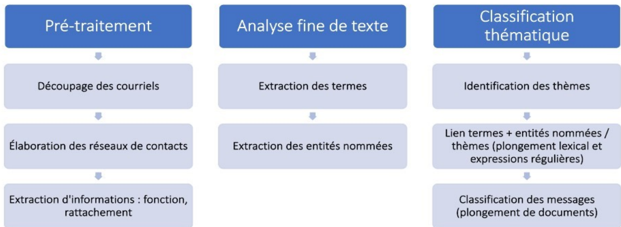
Figure 2: Méthodologie suivie

Deux interfaces ont été développées dans le cadre de ce projet :