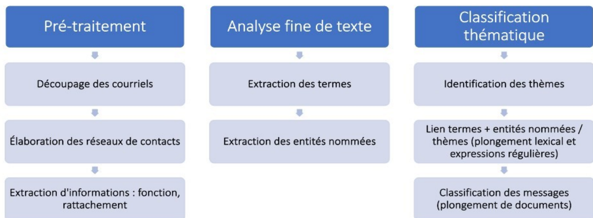
Figure 2: Méthodologie suivie

Deux interfaces ont été développées dans le cadre de ce projet :