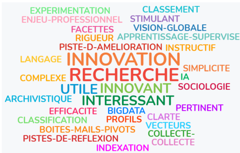
Figure 5: Réponse à la question 10. A l'issue de cet atelier, quels sont les mots clefs que vous mettriez en avant ? (merci de saisir à la suite quelques mots)

Le dernier item du questionnaire (annexe 1) proposait aux répondant·es de citer des mots clefs en rapport avec le projet (fig. 5).