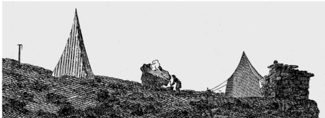
Le laboratoire de Saussure, au col du Géant en 1788.

premier savant « vertical ». Il « raconte » ses voyages et travaux dans ses très fameux Voyages 5 .