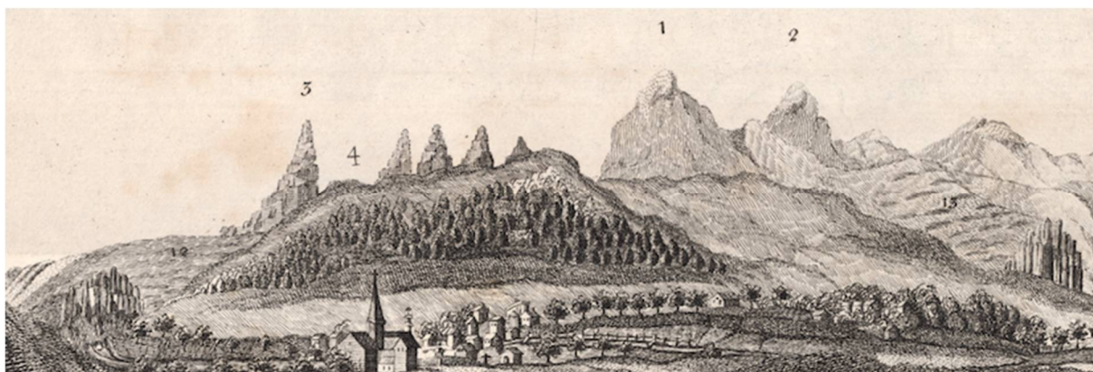
Veüe de la Vallée de Chamouny.