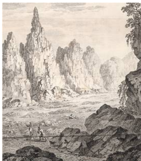
View of the Valle & Mountains that Surround it from Mont Anver.

Robert Price illustre pour la première fois un guide de montagne