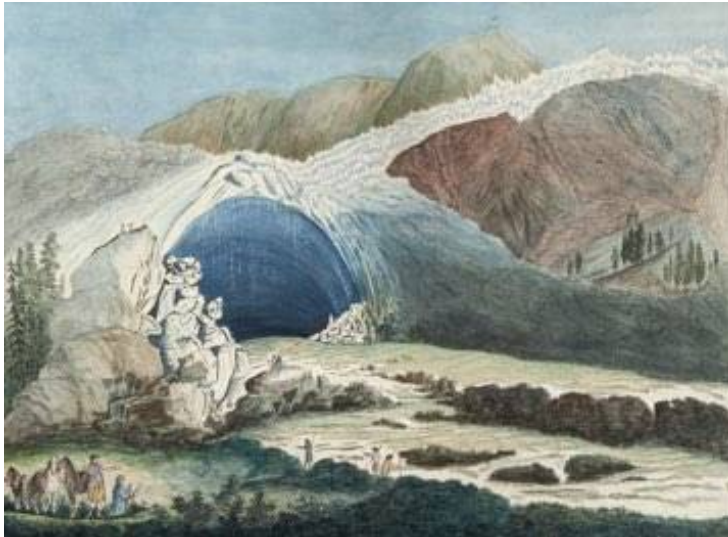
Vüe de la Source de L'arvéron et de son amas de Glace à Chamuni Dessin de Bourrit, daté de 1787