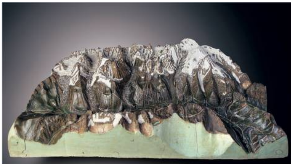
Le plan relief du Mont-Blanc conservé à Görlitz (Allemagne).

Dans les pas de Saussure, Charles-François Exchaquet (1746-1792), chimiste, le premier topographe du Mont Blanc , construit une douzaine de plan-relief (PR) qui représentent de manière pionnière les glaciers [1787-1792]. Le PR géant construit pour le Gouvernement sarde est aujourd'hui conservé à Chambéry.