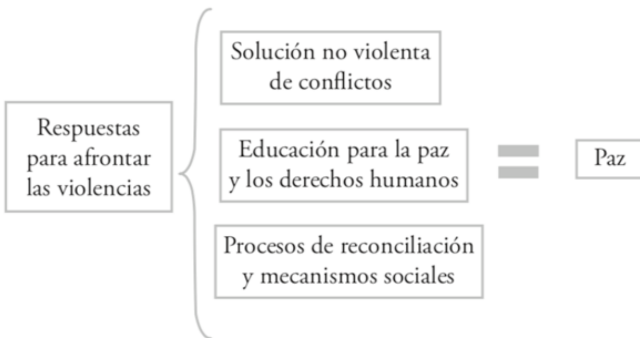
Figura 5: Respuestas para afrontar las violencias. Álvarez, E. González, I. (2017). Educación para la paz y derechos humanos. En Derechos humanos, ciudadanía y paz (190). Guadalajara: Cátedra Eusebio

equidad económica, política, social y cultural» (Lacayo, 1995, p. 14). Por lo cual, se hace referencia más allá de una paz negativa, a una paz positiva. Aquella con las respuestas para afrontar la violencia a través de la solución no violenta de conflictos, la educación para la paz y los derechos humanos, igualmente, con procesos de reconciliación y mecanismos sociales donde hay un buen manejo de conflictos y armonía relacionada con relaciones de tipo madura, cortesía e inclusive amor (Álvarez & González, 2017, p. 154 – 155).