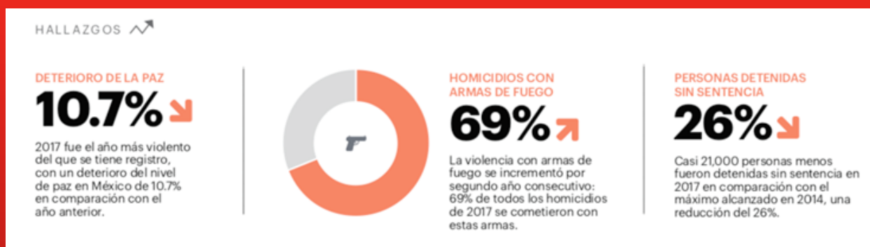
Figura 1: Hallazgos. Institute for Economics and Peace. (2018). Índice de Paz México. 2018, de Institute for Economics and Peace. Sitio Web: https://bit.ly/2qmLo0R

México es considerado alrededor del mundo como un país de riqueza cultural, ecológica y económica, no obstante, una vez que se aborda el tema social, aquel de la situación de paz y violencia, parece que todo va en retroceso. ¿Por qué? Basta con ver la situación de inseguridad que se vive alrededor de la república, desde los pueblos hasta las ciudades. Diversos estudios realizados, como aquel del Instituto para la Economía y la Paz (IEP) y el Índice de Paz México (IPM), afirman que el «2017 fue el año más violento del que se tiene registro, con un deterioro del nivel de paz en México de 10.7% en comparación con el año anterior» (2018, p. 5).