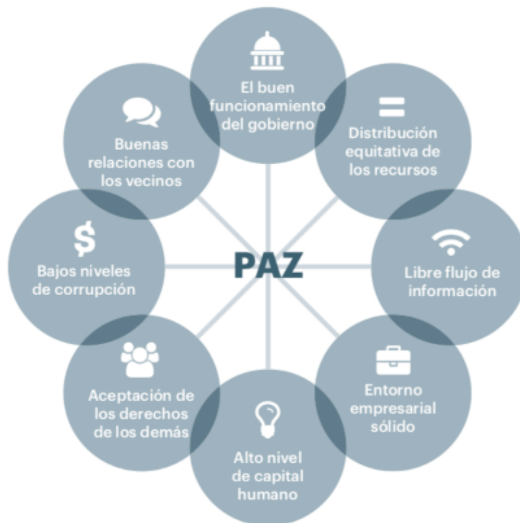
Figura 3: Ocho pilares del IEP. Institute for Economics and Peace. (2018).

Tal respuesta fructífera tiene su base en los ocho pilares para la paz del IEP, que se muestran a continuación: