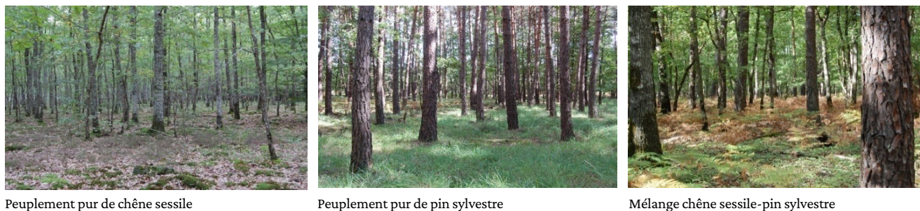
Peuplement pur de chêne sessile

Pour calculer les stocks de carbone, nous avons réalisé des mesures pour estimer les biomasses des arbres, du sous-bois, du bois mort debout, du bois mort au sol (souches et troncs), et des feuilles. L'épaisseur et la teneur en carbone des horizons holorganiques, et du sol minéral (0-60 cm) ont également été utilisés. Des prélèvements pour les analyses du contenu en carbone ont été également réalisés ou, à défaut, des données de la littérature ont été utilisées.