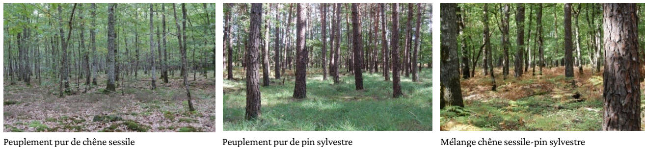
↑ Figure 1. Photographie des 3 types de peuplement du dispositif OPTMix installé au sein de la forêt domaniale d'Orléans (région Centre-Val de Loire, 45)

Pour calculer les stocks de carbone, nous avons réalisé des mesures pour estimer les biomasses des arbres, du sous-bois, du bois mort debout, du bois mort au sol (souches et troncs), et des feuilles. L'épaisseur et la teneur en carbone des horizons holorganiques, et du sol minéral (0-60 cm) ont également été utilisés. Des prélèvements pour les analyses du contenu en carbone ont été également réalisés ou, à défaut, des données de la littérature ont été utilisées.