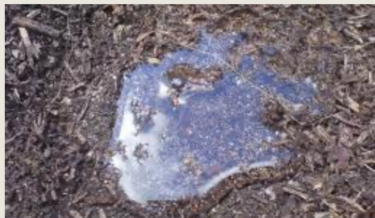
↑ Figure 4. Comportement de l'eau sur un sol hydrophobe Certains sols repoussent l'eau. Ces sols sont appelés « non mouillables », « hydrofuges » ou « hydrophobes ».

L'hydrophobie des sols incendiés est souvent responsable de l'aggravation des ruissellements sur des sols profonds, plutôt à matrice sableuse avec une végétation de type forêts de conifères très denses (cas des feux de Californie et du Colorado, ou encore en Australie).