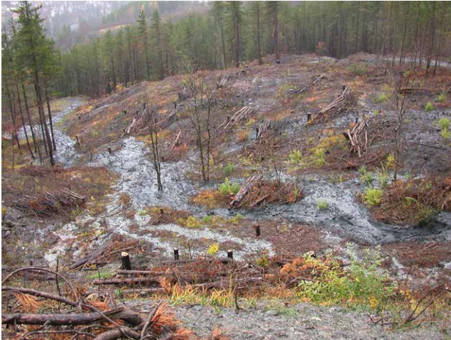
↑ Figure 11. Pluies intenses affectant un versant traité en fascinage

Mais la faisabilité du fascinage n'est pas toujours évidente. Les bois brûlés peuvent être trop gros et donc trop lourds à manipuler, ou en densité insuffisante pour un réel effet. Les pentes trop fortes rendent les travaux trop coûteux et plus dangereux. Les fascines peuvent être installées en haut des talwegs, mais pas trop en aval sans quoi elles risquent de créer des embâcles. Enfin, les travaux de fascinage auraient l'effet inverse à celui recherché s'ils étaient réalisés avec des moyens mécanisés lourds et impactant pour les sols. A noter que les fascines n'ont pas forcément un effet positif sur la reprise de la végétation ; si elles sont installées trop tardivement par exemple, les semis peuvent être étouffés par les branchages puis par l'amoncellement des sédiments en amont.