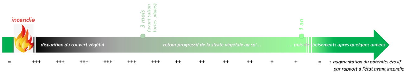
↑ Figure 8. Synthèse d'un retour à une érosion "normale"