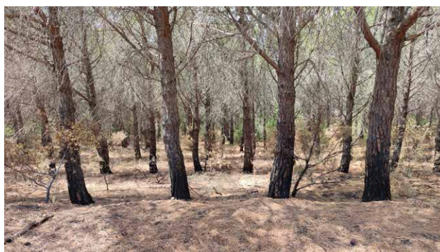
Sols en forêt brûlée avec un indice de sévérité faible