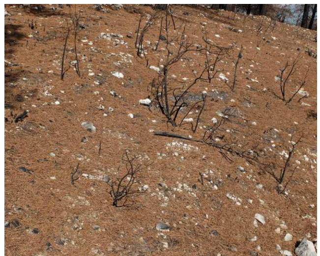
↑ Figure 12. Aiguilles roussies ayant chuté au sol, assurant un bon couvert temporaire

Ensuite, des techniques misant sur le couvert végétal, telles que le recépage ou encore la végétalisation artificielle peuvent être mises en place pour lutter contre l'érosion. La revégétalisation artificielle peut alors être réalisée par des espèces arbustives, parfois plus adaptées que les essences forestières au contexte local (bonne couverture à court terme, résistance à des conditions édaphiques extrêmes, résilience aux incendies...). Comme la reprise de la végétation est en général très faible avant les premières pluies, c'est sur le moyen, voire le long terme, que ces mesures ont un effet.