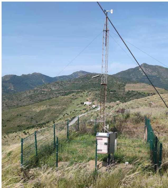
↑ Figure 6. 20 mai 2022 (11 mois après le feu)