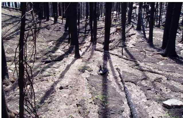
Erosion diffuse du sol (décapage) générée par un écoulement diffus de surface sur des terrains incendiés