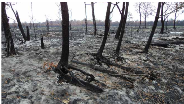
↑ Figure 3. Feu de forte sévérité, avec destruction en profondeur de l'horizon humifère du sol sur terrain sableux

3. La formation d'une couche hydrophobe (sur une profondeur généralement inférieure à 6 cm), par transformation de la matière organique en cire qui colmate les interstices du sol. Cela contribue à l'augmentation du ruissellement et à l'érosion des matériaux situés au-dessus. Cela se produit lorsque certains seuils de température sont dépassés. Pour des feux moins intenses, l'effet peut être moindre ou nul.