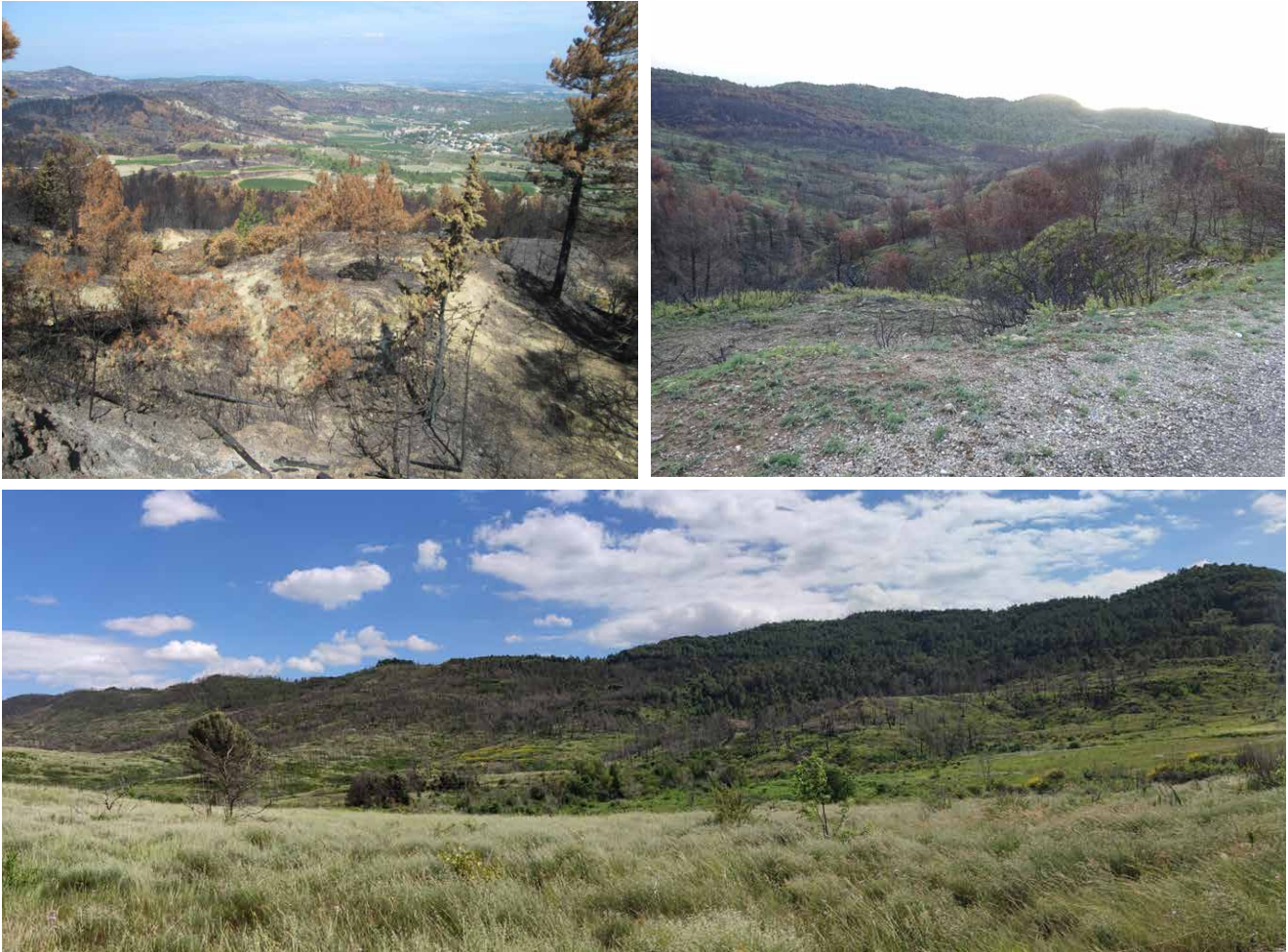
↑ Figure 7. Évolution de la végétation après l'incendie du 14 août 2019 à Monze