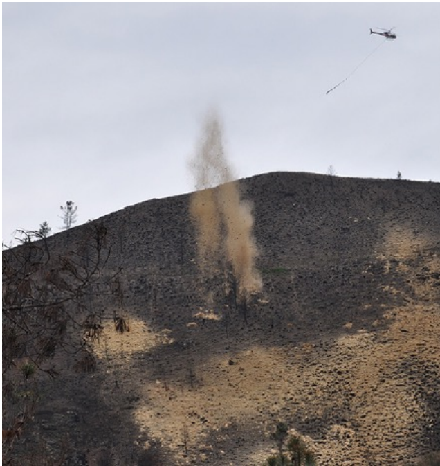
↑ Figure 13. Mise en place de mulch par hélicoptère (2015, Navia de Suarna, Lugo, Espagne)

En mesure d'urgence, une technique courante à l'étranger est le mulching. Il s'agit d'épandre un matériau à la surface du sol pour le protéger. Le mulch évite la formation de croûtes de battance, améliore l'infiltration et limite l'érosion diffuse et le transfert de sédiments vers l'aval. En outre, il crée un microclimat moins aride qui favorise la germination et la reprise de la végétation.