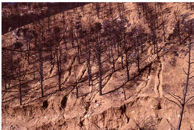
Ravinement en rigoles sur les pentes incendiées de la Buffalo Creek, Colorado