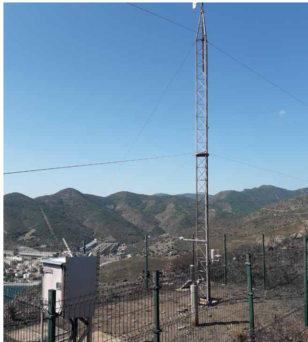
↑ Figure 5. 27 août 2021 (1 mois après le feu)

A Monze (11), l'incendie du 14 août 2019 a impacté une végétation de type garrigue, ainsi que des peuplements fermés de pins. A peine 3 mois après l'incendie, grâce à un automne humide sans épisode pluvieux intense, la végétation rase a rapidement tapissé les sols incendiés. Au bout d'un an la couverture végétale est bonne et au bout de 3 ans elle est totale.