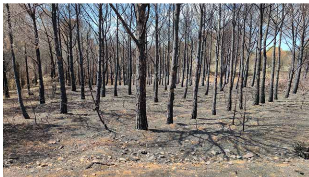
Sols en forêt brûlée avec un indice de sévérité fort