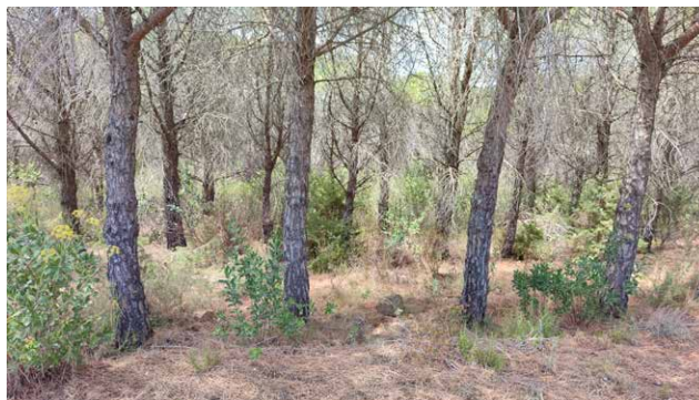
Sols en forêt non brûlée