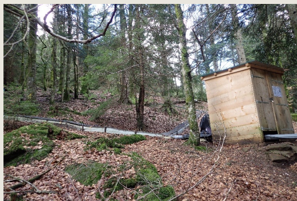
↑ Photo 1 : Vue de l'aval vers l'amont de l'une des placettes de Senones. La cabane contient les instruments de mesures. Une barrière étanche, installée verticalement, permet de délimiter la placette et de collecter le ruissellement.

Il ne s'agit pas, dans ces travaux de recherche, de reproduire les pratiques des forestiers ONF en forêt vosgienne, mais d'être en mesure, à terme, de mieux comprendre comment fonctionne le ruissellement et l'érosion en forêt : l'effet du couvert végétal arboré, celui d'un tassement modéré et partiel du sol, etc. Les mesures se poursuivront quelques années avant que des conclusions soient tirées.