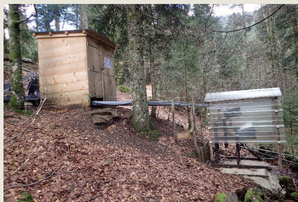
↑ Photo 3 : A la suite de la mesure de la qualité de l'eau effectuée dans la cabane, la quantité de ruissellement est évaluée dans un auget basculeur. Les particules sont ensuite piégées dans un partiteur (non figuré sur la photo).