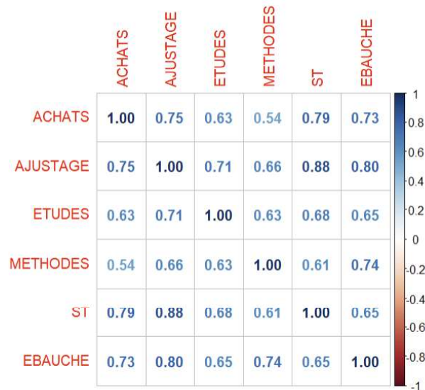
Figure 3. Matrice de corrélation entre les groupes de coûts

La Figure 3 montre que les 6 éléments de coût covarient principalement dans un schéma de corrélation positive, ce qui suggère que leurs prédictions peuvent ne pas être totalement indépendantes les unes des autres.