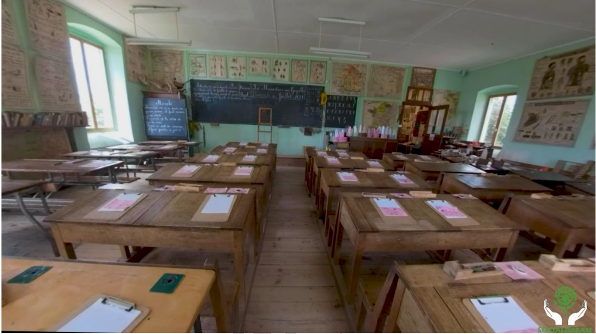
Figure 1 | Image de salle de classe extraite d'une vidéo d'un environnement semi-personnalisé.