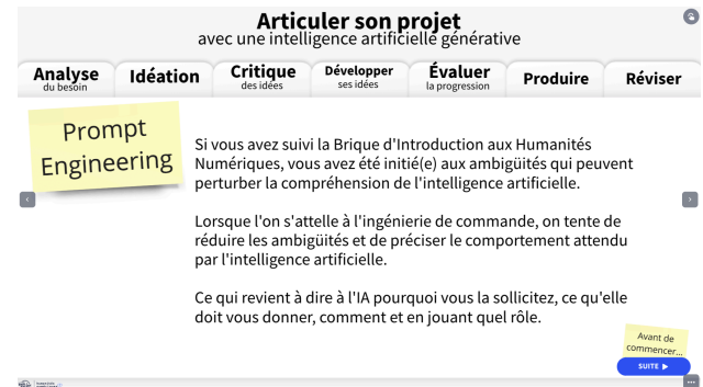
Figure 2 - Extrait de la ressource "Articuler son projet"

pédagogiques, il est maintenant proposé des prompts pour chaque étape de production de l'article de blog (cf. F. Le fil d'ariane de cet item est de considérer l'IA comme un assistant à la prise de décisions, l'idéation, la structuration, la production et la correction d'une production écrite.