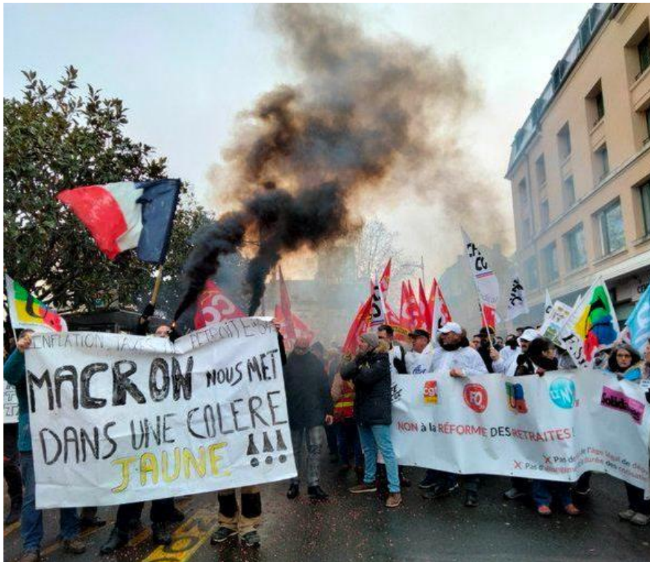
Figure 6. Photographie issue de la manifestation contre la réforme des retraites du 20 janvier 2023 dans une préfecture du centre de la France