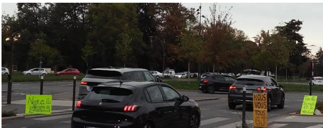
Figure 1. Photographie d'une « opération visibilité et tractage » menée par un groupe de Gilets jaunes du sud-ouest de la France le 20 octobre 2022

Dans le département du sud-ouest de la France étudié, les Gilets jaunes sont plus nombreux encore dans les cortèges contre la réforme des retraites de 2023. Dès les occupations temporaires de ronds-points organisées à l'automne 2022, un noyau d'une quinzaine de protestataires représentant l'« aile gauche » (Ravelli et al. , 2020) des Gilets jaunes locaux mobilisés durablement affiche ostensiblement son opposition à la réforme des retraites annoncée. Lors d'une « opération visibilité et tractage » qui se tient aux abords d'un rond-point stratégique le 20 octobre 2022, soit trois mois avant la première manifestation intersyndicale nationale contre la réforme des retraites, la revendication « Non à la réforme de la retraite » figure ainsi à la fois sur une pancarte jaune fluo disposée à l'une des entrées du carrefour giratoire (voir Figure 1) et sur les tracts distribués aux automobilistes (voir Figure 2).