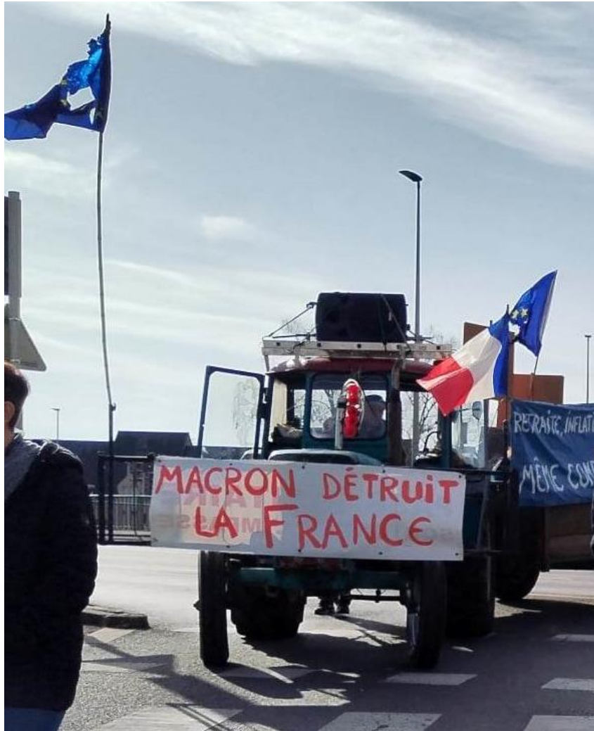
Figure 5. Photographie issue de la manifestation contre la réforme des retraites du 16 février 2023 dans une préfecture du centre de la France

pass sanitaire, et de deux banderoles : « Retraite, inflation, personnels suspendus, pénurie. Même combat contre la Macronie » et « Macron détruit la France » (voir Figure 5).