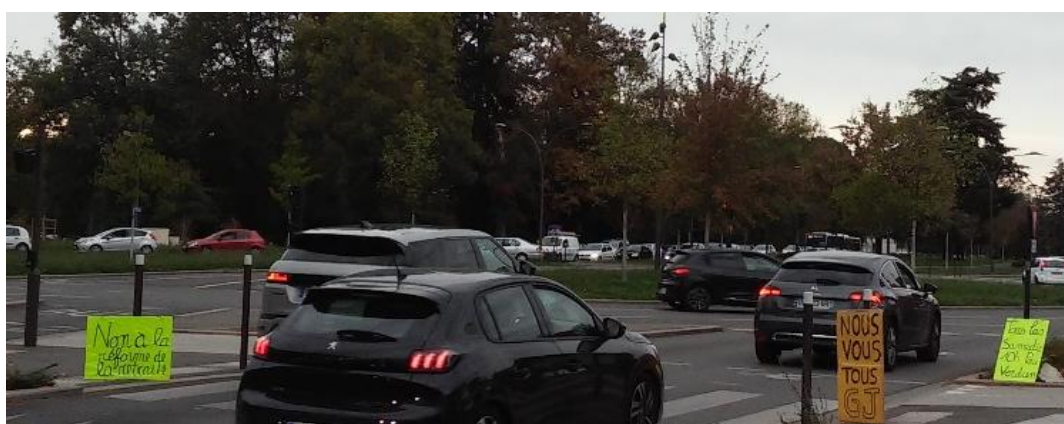
Figure 1. Photographie d'une « opération visibilité et tractage » menée par un groupe de Gilets jaunes du sud-ouest de la France le 20 octobre 2022

Dans le département du sud-ouest de la France étudié, les Gilets jaunes sont plus nombreux encore dans les cortèges contre la réforme des retraites de 2023. Dès les occupations temporaires de ronds-points organisées à l'automne 2022, un noyau d'une quinzaine de protestataires représentant l'« aile gauche » (Ravelli et al. , 2020) des Gilets jaunes locaux mobilisés durablement affiche ostensiblement son opposition à la réforme des retraites annoncée. Lors d'une « opération visibilité et tractage » qui se tient aux abords d'un rond-point stratégique le 20 octobre 2022, soit trois mois avant la première manifestation intersyndicale nationale contre la réforme des retraites, la revendication « Non à la réforme de la retraite » figure ainsi à la fois sur une pancarte jaune fluo disposée à l'une des entrées du carrefour giratoire (voir Figure 1) et sur les tracts distribués aux automobilistes (voir Figure 2).