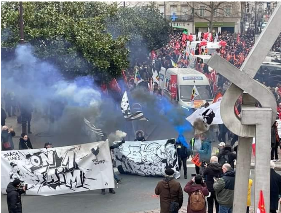
Figure 7. Photographie issue de la manifestation contre la réforme des retraites du 7 mars 2023 dans une préfecture du centre de la France