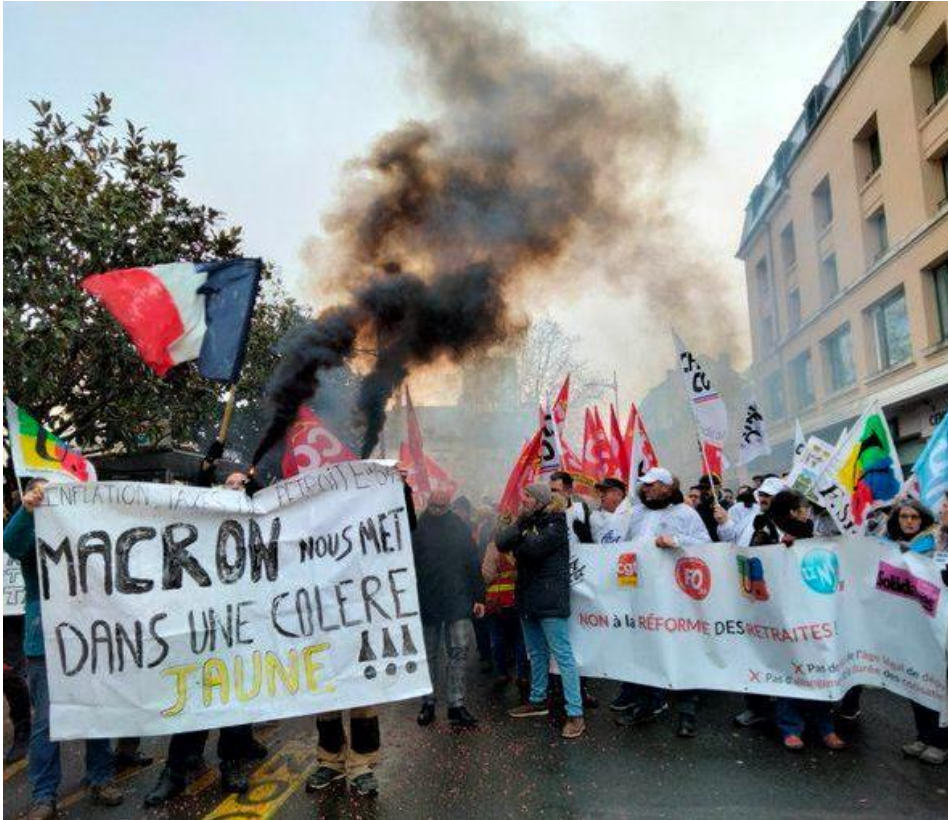
Figure 6. Photographie issue de la manifestation contre la réforme des retraites du 20 janvier 2023 dans une préfecture du centre de la France