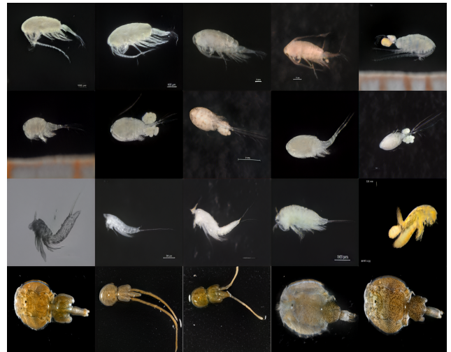
Figure 3: Images synthétiques de copépodes générées par la méthode hiérarchique descendante. 1 ère ligne : Calanoida, 2 ème : Cyclopoida, 3 ème : Harpacticoida et 4 ème : Siphonostomatoida.

Dans le tableau 2, nous présentons les mesures de qualité des trois méthodes. Sans surprise, plus nous avons de données, meilleure est la qualité des images générées ; les modèles entraînés sur le jeu de données Calanoida montrent ainsi les meilleurs résultats. Nous observons que pour chaque spécimen, l’apprentissage par transfert descendant depuis les copépodes permet au modèle de générer des données de meilleure qualité. Cette approche hiérarchique de l’apprentissage par transfert, en commençant par l’entraînement au rang taxonomique plus général (ici Copepoda), puis en affinant le modèle au rang taxonomique plus spécifique semble être la méthode la plus efficace. Notons les différences de perception de qualité d’image des deux métriques utilisées ; en effet, lorsque les modèles entraînés sur les Cyclopoida et les Harpacticoida ont respectivement des KID proches, leurs FID respectifs sont très éloignés. Cette différence est selon nous due aux différences de taille et de diversité des deux jeux de données. En effet le jeu de