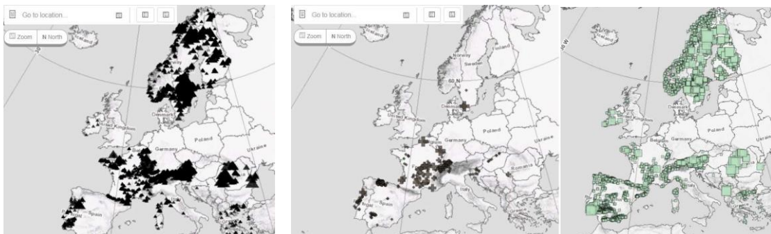
Figure 2 : Distribution du fer (gauche), du charbon (milieu) et du cuivre (droite) en Europe.

Ce travail constitue un véritable travail de recherche, dans le sens où, historiquement, cette technologie n'a jamais existé. Nous considérons qu'il est low-tech, dans la mesure où la métallurgie est une brique essentielle pour fabriquer des outils en fer, nécessaires dans un très grand nombre de systèmes techniques pérennes que l'on pourrait imaginer. Notre intuition est que la présence de la métallurgie dans ces systèmes est crédible, voire certaine, en raison de l'abondance du fer dans la croûte terrestre et de sa relativement bonne répartition spatiale (voir Figure 2), permettant à des communautés régionales ou locales de développer une métallurgie sans avoir recours à du transport à très longue distance. Ce n'est par contre pas le cas du charbon, dont la répartition est bien plus inhomogène, nécessitant du transport à longue grande distance (voir Figure 2).