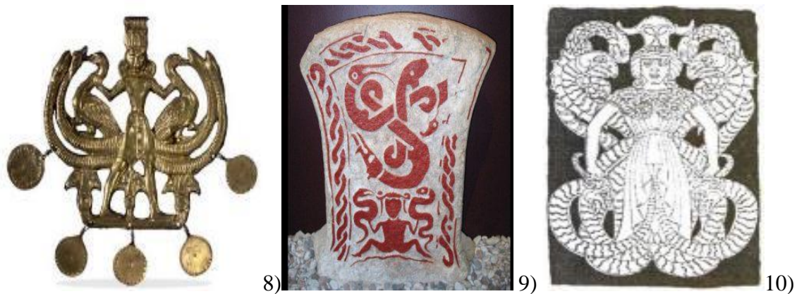
Image 8, Pendentif minoen "Maîtresse des animaux" trouvé sur l'île d'Égine (British Museum, 1700-1500 B.C.E,). N.B. Il comprend 4 serpents et deux oiseaux. Image 9, Pierre tombale, 400-600 CE (, « femme ouverte » tenant deux serpents, surmontée d'une couronne de cornes comme la déesse égyptienne Hathor). Image 10, Déesse des Scythes 11, 300 B.C.E. Nous y constatons le mélange de deux symboles du pouvoir divin : serpent et les cornes d'une vache.

- La série d'images suivantes associées au serpent peut nous aider à comprendre l'évolution du concept qui a migré vers le Nord.