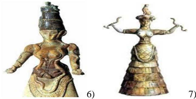
Images 6 et 7 , Statuettes de Cnossos datées d'environ 1600 B.C.E;

- Ce symbole a traversé des milliers d'années et de kilomètres pour apparaître chez les Minoens (voir les statuettes de Cnossos ; EVANS, 1906).