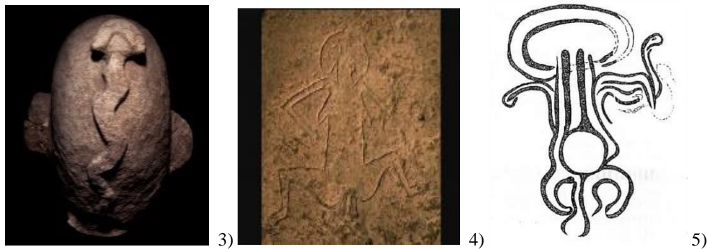
Images 3 et 4 , Artefacts de Göbekli Tepe (vers 6000 B.C.E.) : sculpture de la tête en pierre avec un serpent 10 et gravure une « femme ouverte » (femme accouchant – écho à la Grande Déesse Mère paléolithique) avec une tête de serpent (Photo reproduite avec une aimable autorisation de Vincent J. Musi). Image 5 , La gravure libyenne de Messak (vers 4000 B.C.E, photo reproduite avec une aimable autorisation de son auteur (VAN

Jetons un coup d'œil sur l'horizon culturel de ce symbole à travers l'espace et le temps : - On le trouve en abondance à Göbekli Tepe dans des versions sculpturales et graphiques (SCHMIDT, 2015) et parfois dans l'art rupestre du désert du Sahara (MOSTEFAI, 2013) ;