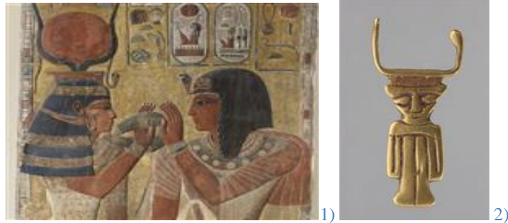
Image 1 , La déesse Hathor accueille SETI I (1294 à 1279 B.C.E ; Paris, Musée du Louvre ; https://www.photo.rmnm.fr ) ; Image 2 , Emblème de la déesse Hathor (Paris, Musée du Louvre ; https://www.photo.rmnm.fr ), N.B, il n'est pas clair que le haut de sa tête soit orné d'un serpent ou de cornes.

C'était un animal héraldique égyptien durant les périodes prédynastique et dynastique. Son symbole est un élément essentiel des coiffes des pharaons égyptiens ainsi que de leurs dieux (GUILLOU & PEVRE, 2014) ; d'habitude il est en forme « L » 9 , mais parfois en « U » :