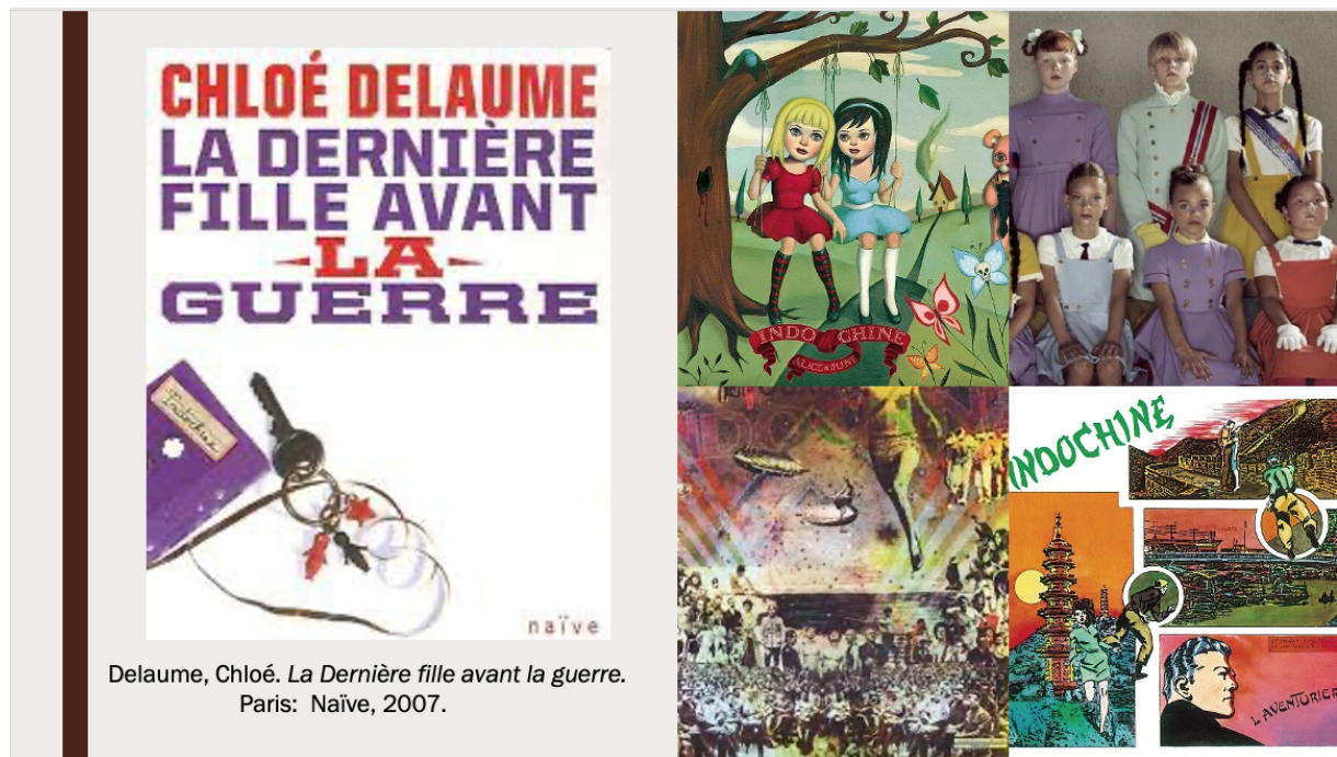
Delaume, Chloé. La Dernière fille avant la guerre . Paris: Naïve, 2007.

Dans La Dernière fille avant la guerre , il s'agit pour Delaume, de revenir sur son statut de fan d'Indochine : de l'été 83 et sa découverte de « L'Aventurier » à l'échec de l'écriture d'une chanson pour l'album Alice & June . Le roman traite de l'essence même de la condition de fan. Si le roman ne le raconte pas, elle composera par la suite les paroles de « Les Aubes sont mortes » qui paraîtra dans l'album d'Indochine La République des Météors (2009) et « Sufragette BB » co-écrite avec Nicola Sirkis pour l'album 13 sorti en 2017, tout est bien qui finira bien.