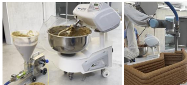
Figure 2 – A gauche le pétrin de boulanger utilisé pour malaxer la terre et la pompe pour extruder la pâte ; à droite le cobot utilisé pour imprimer la pâte de terre crue.