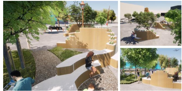
Figure 6 – Visuels en RV d'un îlot de fraîcheur

pour nos besoins. Nous avons aussi mis en place les moyens de malaxage et de pompage de nos matériaux. Nous avons aussi développé la solution robotisée adaptée à de telle réalisation qui repose sur un concept de « robot déplaçable et repositionnable » constitué d'un chariot avec un mat motorisé vertical portant un cobot polyarticulé.