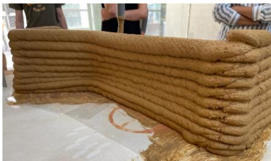
Figure 1 – Test d'impression de terre crue

Aujourd'hui, l'équipe RoMaS du LS2N à l'IUT de Nantes développe ces technologies au service du développement durable. Ils expérimentent l'impression 3D de grande dimension en terre crue pour retrouver l'usage de ce matériau noble, local, quasi gratuit et aux propriétés multiples .