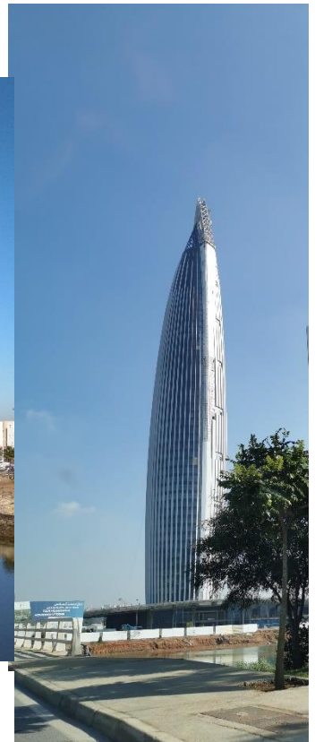
Figure 4 Réalisations des premières séquences du projet (Maryame Amarouche et Max Rousseau, 2023)

Ces processus contribuent in fine à perpétuer l'inégale distribution des populations et des activités économiques au sein de l'aire métropolitaine et remet en cause l'avenir des périphéries et zones grises en général. Au-delà des discours sur le développement urbain durable et la nécessité de préserver des espaces non urbanisés au cœur de la métropole, l'aménagement de la vallée du Bouregreg vise surtout la « montée en gamme » sociale de la périphérie de Rabat-Salé (Rousseau, 2014). Comme l'évoque un agriculteur usager d'un terrain collectif : « Lutter contre l'agence, c'est comme lutter contre l'océan. Vous ne pouvez pas l'arrêter » (notes de terrain, 2017). L'aménagement de la vallée du Bouregreg révèle la diffusion des politiques néolibérales dans des espaces jusqu'alors marginalisés. Dès lors, comment l'avancée continue de l'urbanisation affecte-t-elle les usagers traditionnels de ces espaces, et en premier lieu les agriculteurs ?