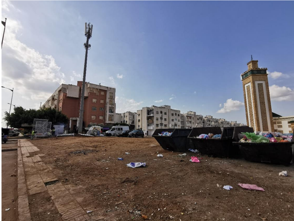
Figure 3 Les déchets montrent les difficultés de gestion de la ville nouvelle (Maryame Amarouche, 2023)

Au final, l'urbanisation d'une importante surface agricole à la périphérie de Rabat révèle une série de contradictions entre les ambitions des politiques publiques nationales et les modalités de leur mise en œuvre locale. La ville nouvelle est toujours en chantier, la mixité sociale n'est pas atteinte du fait d'une concentration de logements sociaux et abordables et d'un bidonville qui se trouve toujours au cœur de la ville nouvelle. Tamesna démontre toutes les limites du nouveau rôle central de l'Etat comme « facilitateur » de l'investissement privé, un processus observé dans de nombreuses autres villes nouvelles des Suds (Côté-Roy et Moser, 2019). De ce fait, après la crise financière de 2008 qui affecte l'ensemble du projet des villes nouvelles marocaines, cette phase d'ouverture maximale aux investissements laisse place à de grands projets au sein desquels la puissance publique tente de contrôler plus étroitement l'urbanisation des périphéries urbaines. Dans la conurbation de Rabat-Salé-Témara, c'est par exemple le cas du grand projet d'aménagement des rives du Bouregreg mis en œuvre par une agence publique créée ex nihilo . Comme nous allons le voir, cette recentralisation de la périurbanisation, si elle s'accompagne d'une volonté de freiner la périurbanisation « anarchique », ne débouche pour autant pas davantage sur la préservation des activités et modes de vie ruraux.