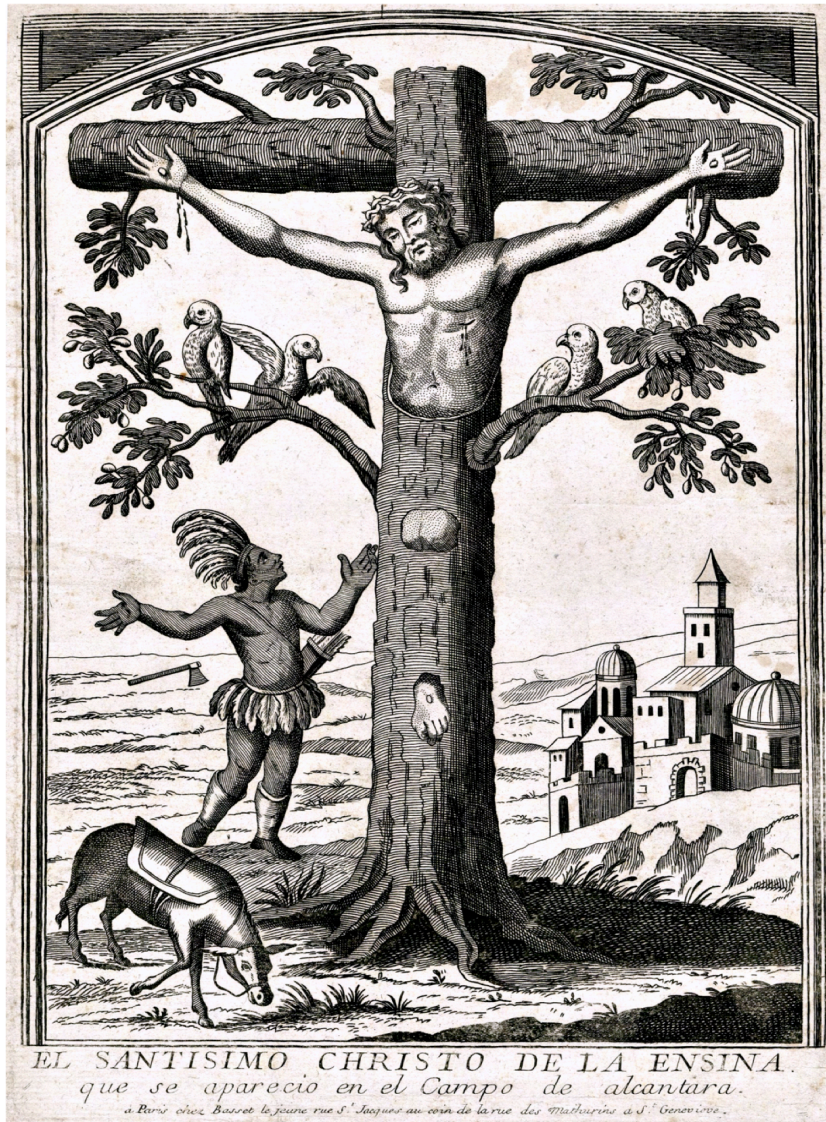
EL CHRISTO DE LA ENCINA OU LE CHRIST DU CHÊNE. CULTE MEXICAIN FONDÉ SUR L'APPARITION DU CHRIST DANS UN CHÊNE. GRAVURE ANONYME, 1750. CONSERVÉ AU BRITISH MUSEUM, LONDRES, ROYAUME-UNI. N° INVENTAIRE 1231.46.