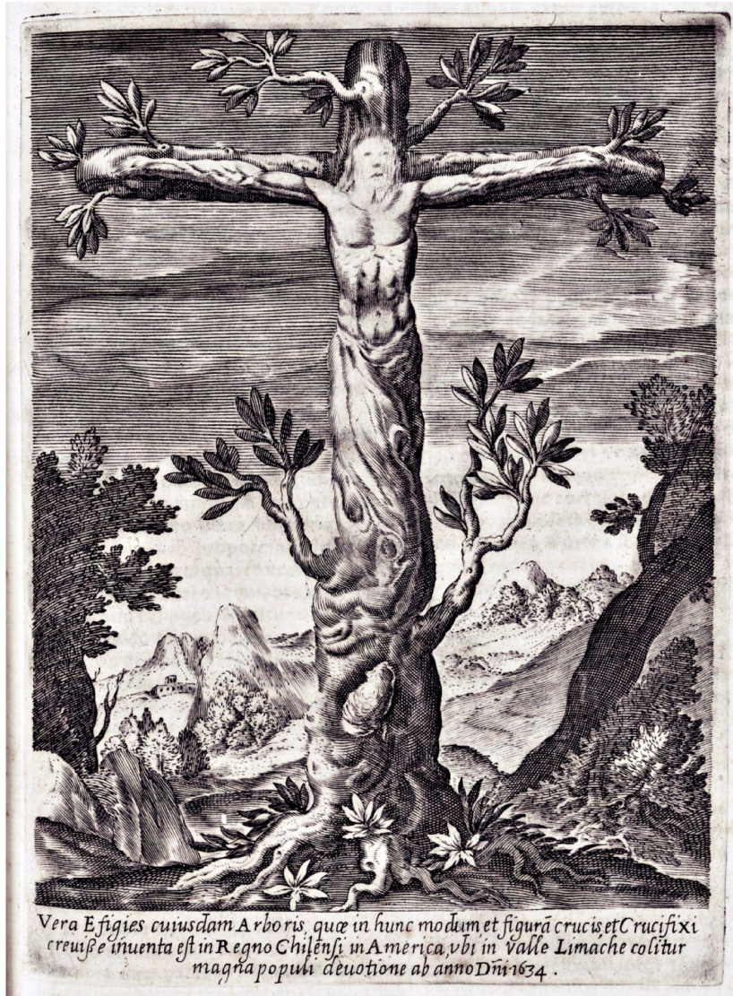
HISTÓRICA RELACIÓN DEL REINO DE CHILE Y DE LAS MISIONES Y MINISTERIOS QUE EJERCITA EN ÉL LA COMPAÑÍA DE JESÚS OU RÉCIT HISTORIQUE DU ROYAUME DU CHILI ET DES MISSIONS ET MINISTÈRES QUI Y SONT EXERCÉS PAR LA COMPAGNIE DE JESUS .... PAR ALONSO DE OVALLE, 1646 - GRAVURE PAGE 58. ÉDITION DE ROME, FRANCISCO CABALLO, 1646. ANTIDATE, FIN XVIII e / DÉBUT XIX e SIÈCLE (CF. PLANCHE CAP. D . INIGO D AIALA).