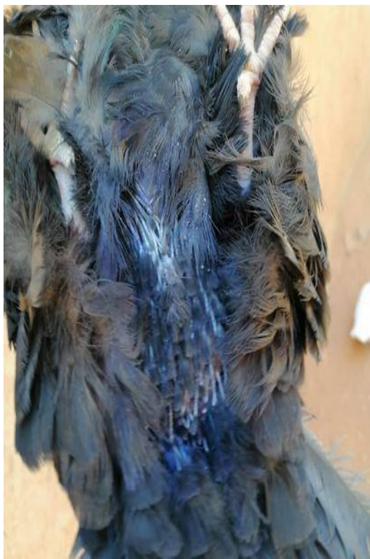
Figure 1 : Graisse à localisation dermique