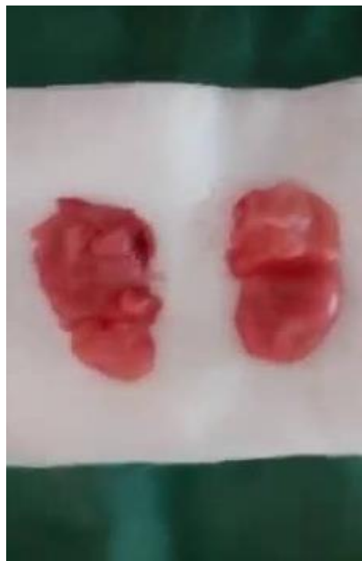
Figure 2 : Graisse localisée dans le sous conjonctif cutané