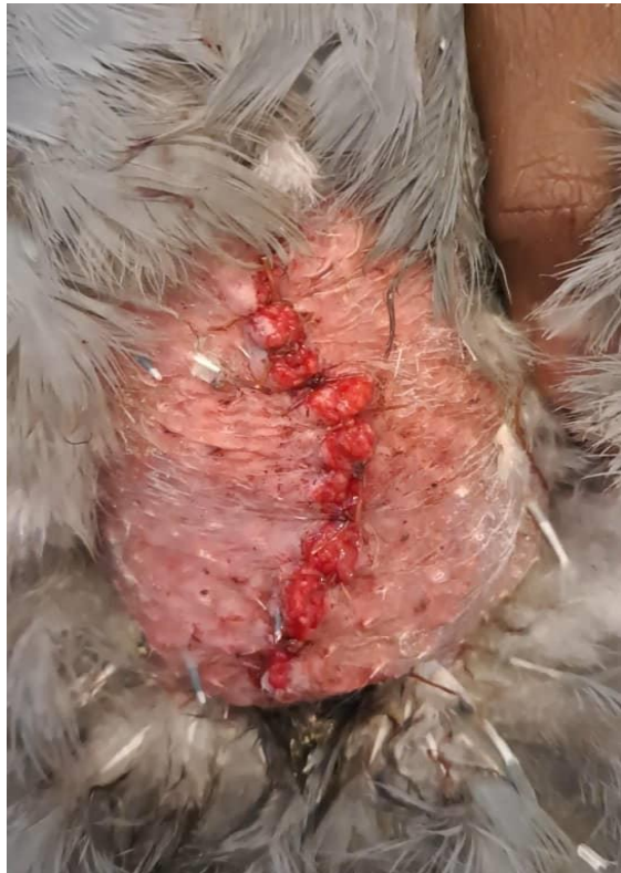
Figure 3 : Graisse à localisation intra abdominale