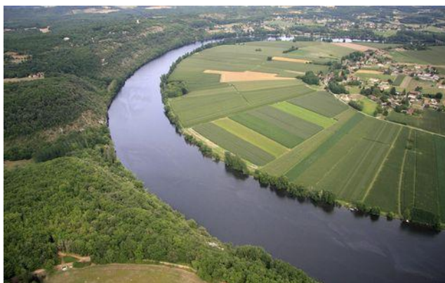
Figure 5 : Vue aérienne d'un méandre de la Dordogne.