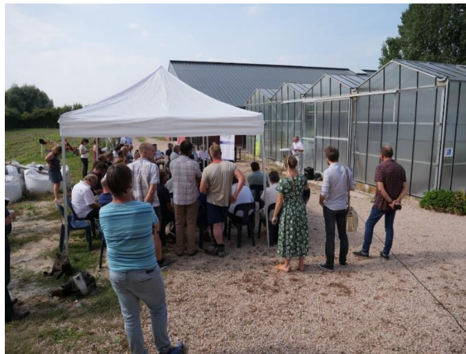
Figure 1c : Journée d'information et débat sur les projets agricoles, dans la Réserve de biosphère du Marais Audomarois.

Si, comme attendu, les agriculteurs se retrouvent au cœur de l'ensemble des projets, la constitution de collectifs mêlant différents groupes sectoriels est fréquemment observée, ainsi que l'engagement du monde associatif bien présent : ainsi AgroBioPérigord qui a fédéré plus de 400 adhérents en 30 ans, principalement des agriculteurs mais aussi des jardiniers, des transformateurs, des distributeurs et des consommateurs 4 , contribue à la mise en œuvre d'une transition agroécologique à l'échelle du territoire. Elle a, par exemple, accompagné le projet de plateforme territoriale de produits bio locaux (Tableau I, projet n°2).