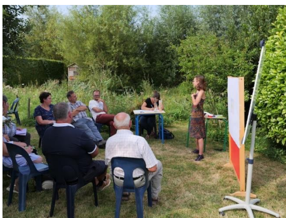
Figure 1a : Atelier de concertation dans la Réserve de biosphère du marais Audomarois, août 2019.

L'agroécologie est un concept polysémique dont le principe original vise à concevoir des systèmes de production agricole s'appuyant sur les fonctionnalités offertes par les écosystèmes (Altieri et al., 1983; Gliessman, 1990). Changeant progressivement d'échelle, de la parcelle à celle du paysage, du système de production au système alimentaire, son approche scientifique centrée sur l'agronomie et l'écologie inclut également les sciences humaines, économiques et sociales (Tomich et al., 2011 ; Gascuel et Magda, 2015 ; Duru et al., 2014). Parallèlement l'agroécologie se développe comme un mouvement social recouvrant une dimension politique (Wezel et al., 2009 ; Lacey et Lefèvre 2015). Le terme « agroécologie » a ainsi évolué et diffusé dans les sphères scientifiques, politiques et de la société civile comme un nouveau paradigme pour repenser les activités agricoles mais n'en reste pas moins source de controverses politico-scientifiques (Wezel et al., 2009 ; Arnauld de Sartre et al., 2020 ; Arrignon et Bosc, 2020). Bien que l'agroécologie soit soutenue officiellement en France par le Ministère de l'Agriculture depuis 2012 par la mise en place de plans d'action, le modèle conventionnel intensif reste largement dominant même si les alternatives se multiplient (Arrignon et Bosc, 2020 ; Lucas et al., 2020 ; L'atelier paysan, 2021 ; Gasselinet al., 2021).