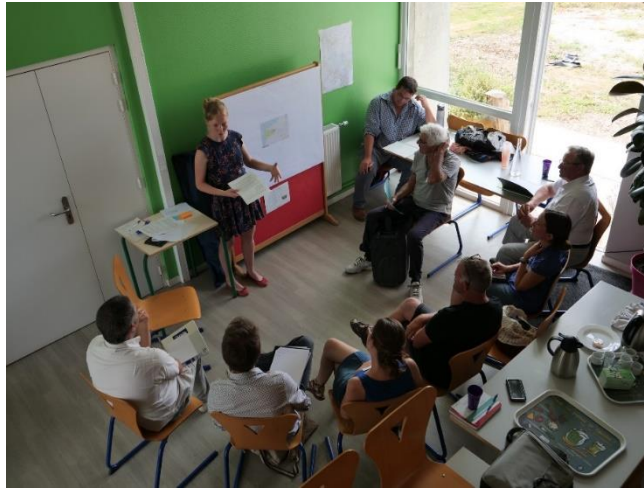
Figure 1b : Réunion de discussion sur la transition agricole, dans le marais Audomarois.

transition (Duru et al., 2014 ; Ollivier et al., 2018 ; Bergez et al., 2019 ; Pignal et al., 2019 ; Pionetti, 2020).