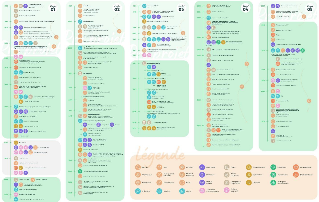
Figure 2 : Lignes de vie des projets engagés dans une transition « agroécologique » proposés par les différents participants. Conception C. Hervé, infographie C. Caston