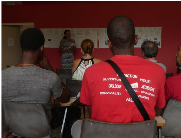
Figure 3 : Atelier de restitution du projet VALAB, Guadeloupe, décembre 2019.

certaines formes d'indépendance ainsi que les sources de financement, sont autant de conditions qui en amènent certains à participer et porter des projets de recherche-action et à en assurer l'accompagnement s'il n'y a pas de recrutement prévu à cet effet. A contrario, les agriculteurs devront prendre sur leur temps de travail, pour un hypothétique gain sans contreparties, leur indemnisation pour ce type d'activité restant encore très marginale en France (contrairement aux pays du Sud).